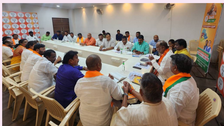
రాష్ట్ర వ్యాప్తంగా ఓబిసి సమీకనాలకు