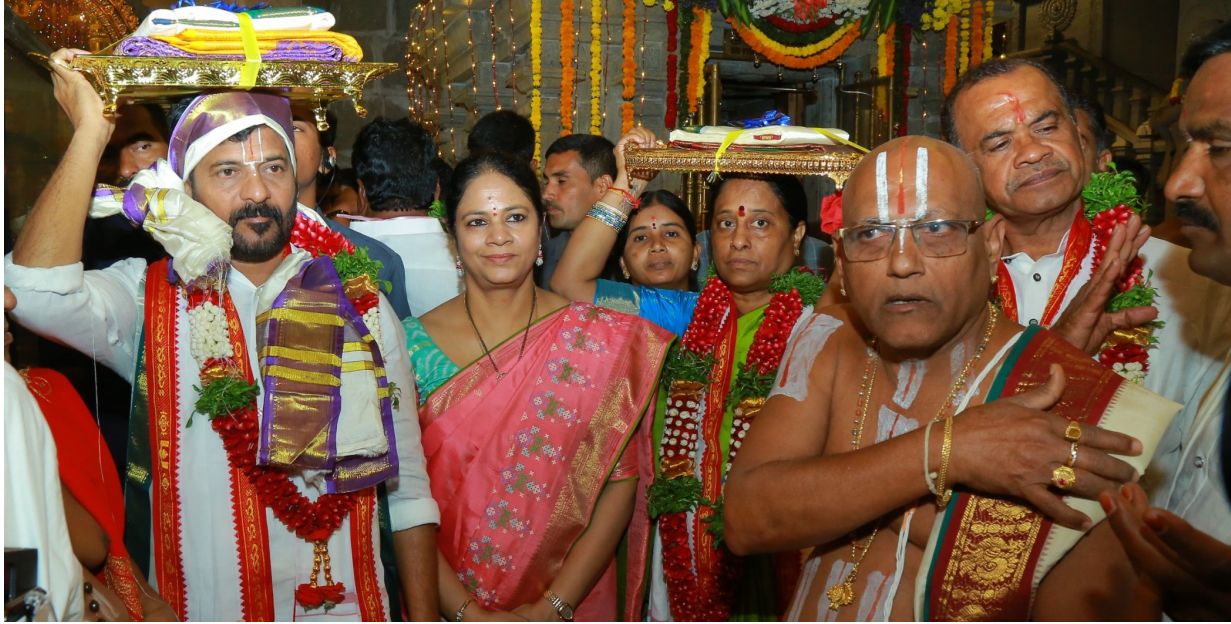
వైభవంగా శ్రీ లక్ష్మీనరసింహ స్వామి