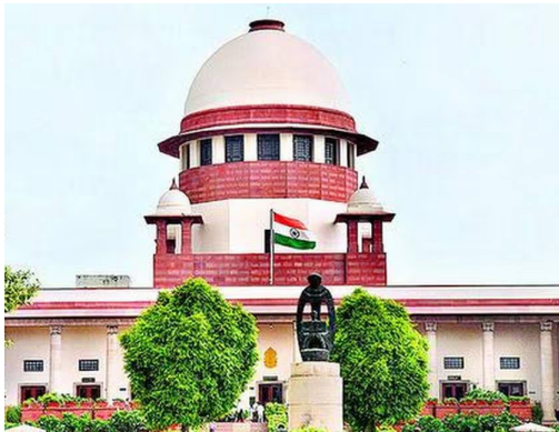
సుప్రీంకోర్టులో పిటిషన్ దాఖలు చేసినది. ఎన్నికల కమిషనర్

తెలుపుతోంది. 2023లో ఇచ్చిన సుప్రీంకోర్టు తీర్పును పాటించాలని కోరుతోంది. ఈ క్రమంలోనే కాంగ్రెస్