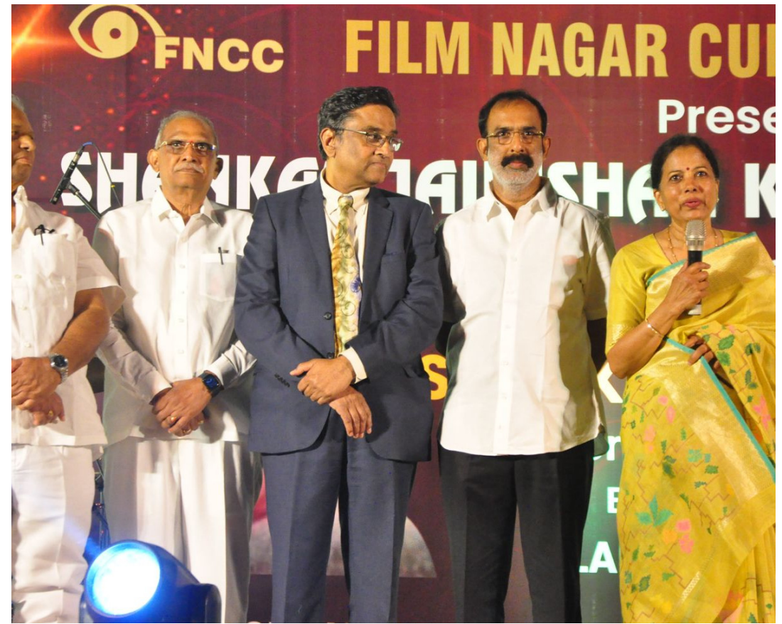
ఎఫ్ఎన్ఎస్ఐలో శంకర్ జైకిషన్ డైమండ్ జూబ్లీ సందర్భంగా