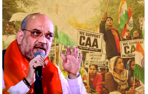
పారసత్వ సవరణ చట్టం-2019