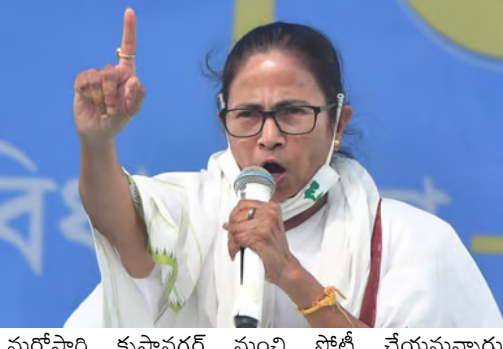
మరోసారి కృష్ణానగర్ నుంచి పోటీ చేయనున్నారు. ఉత్తరప్రదేశ్ లో ఒక స్థానం నుంచి పోటీకాగా సమాజ్ వాడీ

పశ్చిమబెంగాల్ ముఖ్యమంత్రి, తృణమూల్ కాంగ్రెస్ పార్టీ అధినేత్రీ మమతాబెనర్జీ సంవలన నిర్ణయం తీసుకున్నారు. లోక్ సభ ఎన్నికల్లో ఒంటరిగా వెళ్లాలని నిర్ణయించుకున్న డి. రాష్ట్రంలోని 42 లోక్ సభ స్థానాలకు అభ్యర్థులను ప్రకటించారు. అందులో మాజీ క్రికెటర్ యాసఫ్ పతాన్, ప్రస్తుత ఎంపీ మహావా మొయిత్తా పేర్లు కూడా ఉన్నాయి. మొత్తం 8 మంది సీనియర్ ఎంపీలకు తిరిగి దక్కలేదు. దిల్లీ దక్కని వారిలో ఎంపీ సుప్రత్ జహన్ కూడా ఉన్నారు. బహుమతి పురస్కారం మంత్రి క్రికెటర్ యాసఫ్ పతాన్ బరిలో దిగనున్నారు. మార్చి నుంచి నవీ రచనా బెనర్జీకి అవకాశం కల్పించారు. ఆమె తెలుగులో బాగా పనిచేస్తా..? తో అవినీతి ఆరోపణలపై హిరోయన్స్ నడించారు. ఇక అవినీతి ఆరోపణలపై పార్లమెంటు సభ్యత్వం కోల్పోయిన మహావా మొయిత్తా