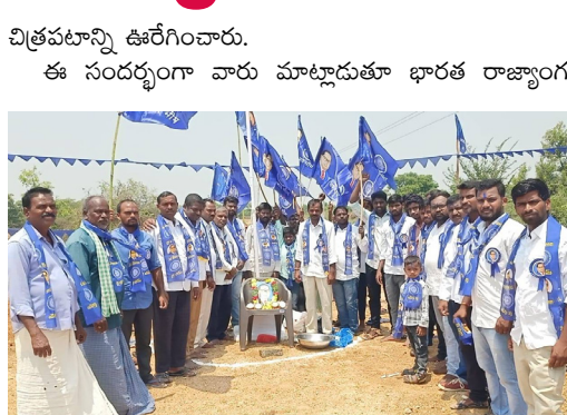
చిత్రపటాన్ని ఊరేగించారు. ఈ సందర్భంగా వారు మాట్లాడుతూ భారత రాజ్యాంగ