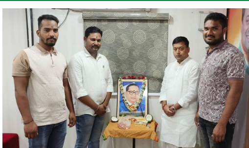
శిఖరాలను అధిరోపించిన మహానుభవ వ్యక్తి డాక్టర్ బిఆర్