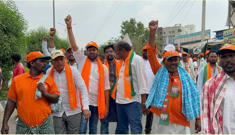
అరుణమ్మ గారిని గెలిపించవలసిందిగా ప్రార్థన ప్రతి ఒక్కరు పనిచేసి బిజెపి సత్తా పాలమూరు పార్లమెంటులో చూపిద్దాం... ఓట్ ఫర్ బిజెపి అరుణమ్మ గారి నాయకత్వం వర్ధిల్లాలి.