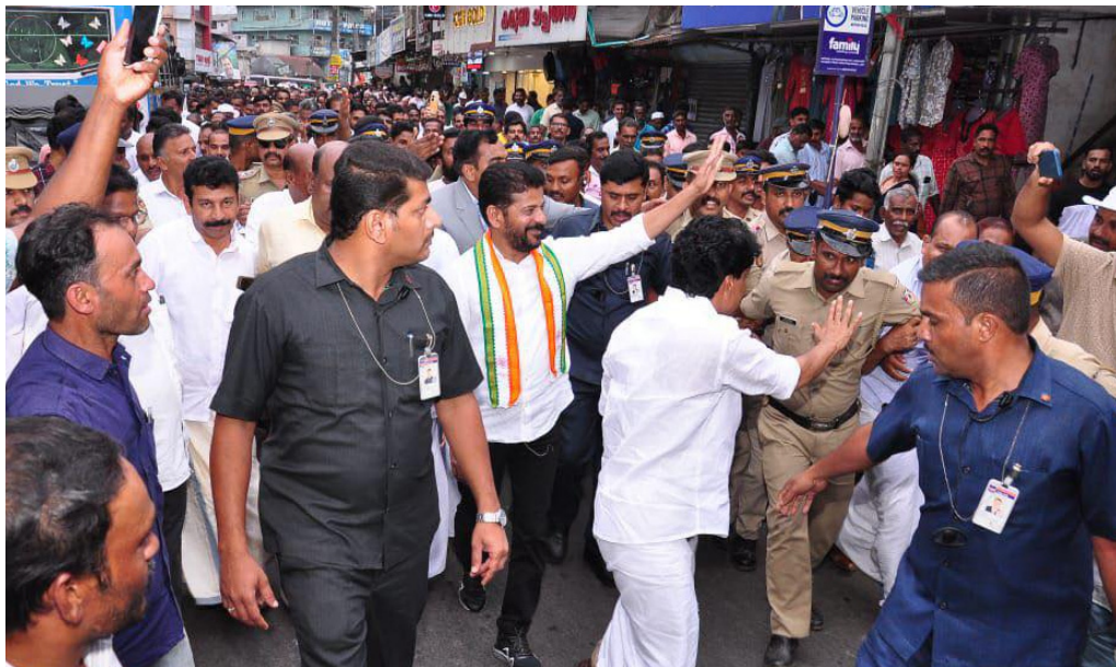
రాహుల్ గాంధీ ప్రధాని కావడం ఖాయం