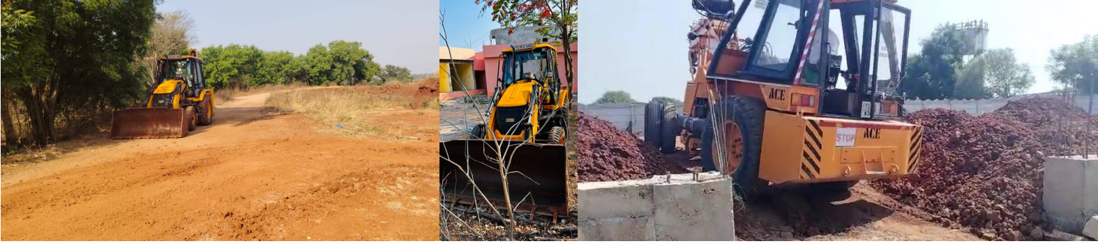
సీజ్ చేసిన జెసిబి, నూతనంగా నిర్మిస్తున్న ఫంక్షన్ హాల్

కల్పించారు. తల్లితండ్రులు తప్పనిసరిగా తమ పిల్లలను అంగన్వాడీ కేంద్రాలలో చేర్పించాలని అంగన్వాడీ కేంద్రాల మానసికంగా, శారీరకంగా ఎదగడానికి పిల్లలకు పాస్టికాహారం అందిస్తామని తెలిపారు. అంగన్వాడీ సేవలను వినియోగించుకోవాలని పిల్లల తల్లిదండ్రులను కోరారు. ఈ కార్యక్రమంలో స్కూల్ డీపర్ట్ అయ్యప్పలు గర్వవతులు మరియు పిల్లల తల్లిదండ్రులు తదితరులు పాల్గొన్నారు.