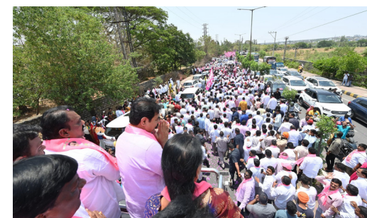
111 జీవోను కూడా ఎత్తివేసింది కేసీఆర్ మాత్రమే అన్నది గుర్తు చేసుకోవాలని సూచించారు.

ప్రశ్నించారు. కేసీఆర్ అభివృద్ధి చేసిన పదేళ్ల పాలన ఒకవైపు... 100 కోట్ల అబద్ధాల పాలన ఒక వైపు ఉంది అలోచించి ఓట్ల వేయాలని అభ్యర్థించారు. రైతుబంధు, కళ్యాణ లక్ష్మి, రైతుబీమా, కేసీఆర్ కిట్ ఇలా చెప్పాకంటే టూ షోట్ కేసీఆర్ ఎన్నో మంచిపనులు చేశారు. చేపట్టిన బ్రహ్మాండమైన అభివృద్ధి చేసుకున్నాం. వికారా బాధితుల జిల్లా చేసుకున్నాం.