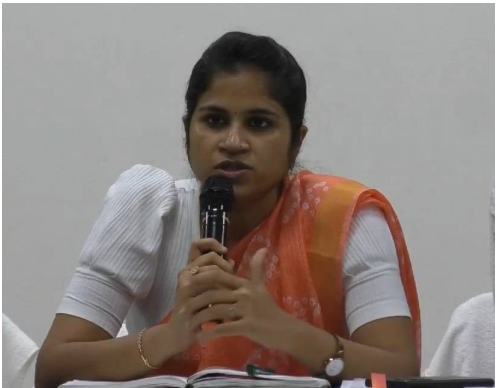
కార్యక్రమాలను కలెక్టర్ వివరించారు. ఈ సందర్భంగా నియోజకవర్గ పరిధిలోని క్రిటికల్ పోలింగ్ స్టేషన్ల వివరాలు గ్రేవెన్స్ కమిటీ వివరాలు చెక్ చేస్తుంటే వివరాలు ఎస్