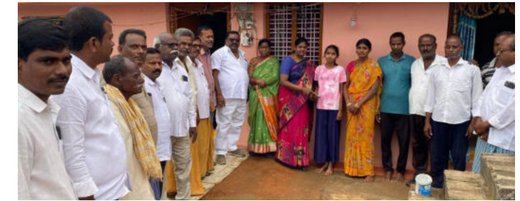
రామన్నపేట వెలుతురు సూన్ ఫిబ్రవరి 24: