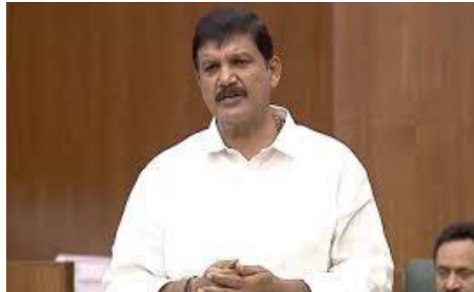
అమరావతి, ఫిబ్రవరి24 ( వెలుతురు):