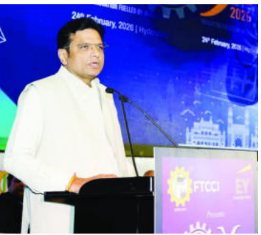
హైదరాబాద్, ఫిబ్రవరి 24 వెలుతురు: తెలంగాణను అంతర్జాతీయ పెట్టుబడులకు గమ్యస్థానంగా మార్చాలనే లక్ష్యంతో.. త్వరలోనే 'ఈజ్ ఆఫ్ డూయింగ్ బిజినెస్

2.0'కు శ్రీకారం చుట్టబోతున్నామని రాష్ట్ర శ్రీధర్ బాబు మాట్లాడుతూ... గ్రోత్ అంటే యాదృచ్ఛికంగా వచ్చేది కాదని, భావి తరాల భవిష్యత్తు కోసం శాస్త్రీయంగా, ప్రణాళికాబద్ధంగా రూపొందించుకోవాల్సిన అవసరం ఉందన్నారు. ఆ దిశగానే రాష్ట్ర ప్రభుత్వం 'తెలంగాణ విజన్ 2047' ను రూపొందించినందుకు ప్రస్తుతం 200 రూపొందిస్తామన్నారు. మంగళవారం ఉన్న జూబిలీహిల్స్ లోని జేఆర్పీ కన్వెన్షన్ సెంటర్ లో ది ఫెడరేషన్ ఆఫ్ తెలంగాణ ఛాంబర్స్ ఆఫ్ కామర్స్ అండ్ ఇండస్ట్రీ (ఫ్యాస్సీ) ఆధ్వర్యంలో నిర్వహించిన 'గ్రోత్ ఎక్స్ 2026' సదస్సుకు ఆయన ముఖ్య అతిథిగా