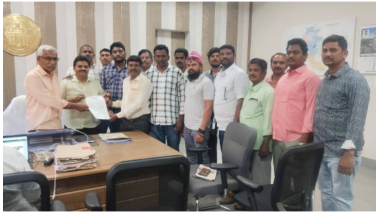
ఖమ్మం, వెలుతురు ఫిబ్రవరి 24: