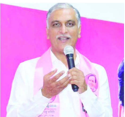
వ్యాఖ్యానించారు. దేవాదుల ప్రాజెక్ట్ మొదటి ప్రాధాన్యమని చెబుతూనే పూర్తిగా నిర్లక్ష్యం చేస్తున్నారని ఆరోపించారు. గోదావరి నీళ్లను పొలాలకు మళ్లించింది బీఆర్ఎస్ ప్రభుత్వమేనని.. కాంగ్రెస్ ఏమీ చేయలేదని బీఆర్ఎస్ ఎమ్మెల్యే పేర్కొన్నారు. అసెంబ్లీలో కెమెరా తిప్పకుండా, మైక్

కాంగ్రెస్ ప్రభుత్వం వచ్చిన రెండేళ్లలో దేవాదుల నుంచి ఒక్క ఎకరా భూమిని సేకరించలేదని, సాగునీరు అందించలేదని మాజీ మంత్రి హరీష్ రావు విమర్శించారు. మంత్రుల మాటలకు, సీఎం మాటలకు పొంతన లేదన్నారు. ఈ ప్రభుత్వానికి డేట్లు, డెడ్లైన్లు మాత్రమే మారుతున్నాయని హరీష్ రావు అన్నారు. ఈ మేరకు ముఖ్యమంత్రి రేవంత్ రెడ్డిపై మాజీ మంత్రి హరీష్ రావు మరసారి విరుచుకుపడ్డారు. మంగళవారం వరంగల్ లో నిర్మాణంలో ఉన్న 24 అంతస్తుల సూపర్ స్పెషాలిటీ ఆసుపత్రి పనులను మాజీ మంత్రి పరిశీలించారు. అనంతరం ఆయన మీడియాతో మాట్లాడుతూ.. దేవాదుల ప్రాజెక్టును తాము సందర్శించిన వెంటనే సీఎం రిప్పుచే చేశారని.. తాము తల్లిదండ్రులే సీఎం నిర్దేశానుసారా