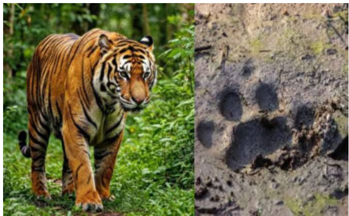
రాజమండ్రి, ఫిబ్రవరి24 ( వెలుతురు):

- అప్రమత్తంగా ఉండాలని హెచ్చరించిన అటవీ అధికారులు