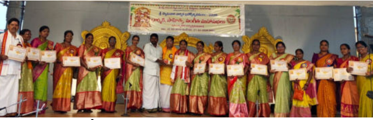
యాదగిరిగుట్ట శ్రీ లక్ష్మీ నరసింహ స్వామి బ్రహ్మోత్సవాలా సంధర్భంగా 24/02/2026 మంగళవారం రోజున స్థానిక శ్రీ భాగ్యలక్ష్మి మహిళా భజన బృందం వారు భక్తి కీర్తనలతో భక్తులను ఆలంబించారు

చైరమన్ గా, అంగన్వాడీ డీవర్ కన్వీనర్ గా బాధ్యతలు నిర్వహించనున్నారు. మిగతా తొమ్మిది మంది సభ్యులుగా గ్రామానికి చెందిన ప్రతినిధులను ఎంపిక చేశారు.