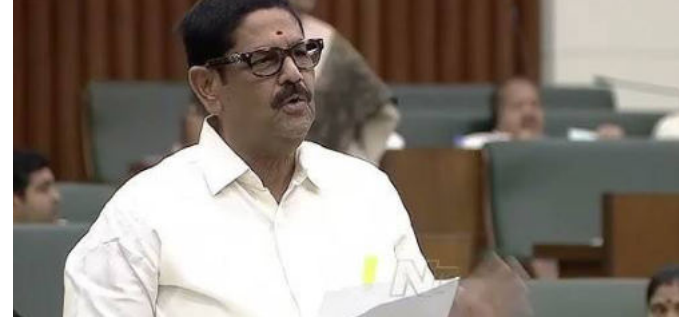
అమరావతి, ఫిబ్రవరి24 ( వెలుతురు):

- అసెంబ్లీలో కల్లీ లద్దా కేసు వివరాలు వెల్లడించిన ఆసం