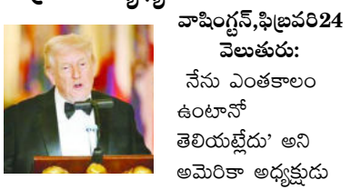
వాషింగ్టన్, ఫిబ్రవరి 24 వెలుతురు: నేను ఎంతకాలం ఉంటానో తెలియజేయ 'అని అమెరికా అధ్యక్షుడు