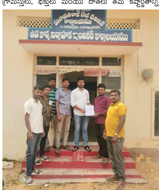
గ్రామస్తులు, భక్తులు మరియు దాతలు తమ కష్టాతికాన్ని వెల్లించారు. ప్రభుత్వ ధనంపై భారం పడకుండా, సామాజిక బాధ్యతతో దీనిని నిర్మించడం జరిగిందన్నారు.

రామన్నపేట వెలుతురు సూన్ ఫిబ్రవరి 24: దాతల సహకారంతో నిర్మించిన కళా వేదిక తొలగింపు వారి మనోభావాలను దెబ్బ తీసే ప్రయత్నం జరుగుతుందని నిర్దేశించిన హనుమాన్ యాత్ అసోసియేషన్ సభ్యులు ఆరోపించారు.