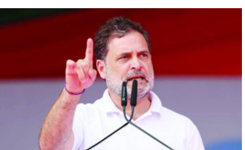
భోపాల్, ఫిబ్రవరి 24 వెలుతురు: భారత్-అమెరికా వాణిజ్య ఒప్పందంపై లోకసభలో విషక్ష నేత రాహుల్ గాంధీ మరోసారి ప్రధానమంత్రి నరేంద్ర