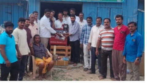
మోతూర్, మార్చి 1, (వెలుతురు సూన్స్ ):