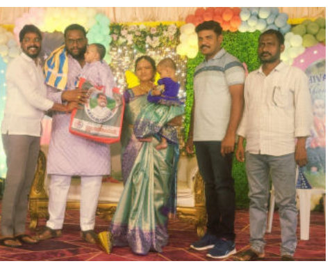
కేసముద్రం వెలుతురు మార్చి 01: