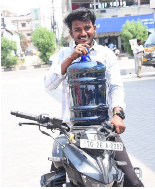
శంకర పల్లి వెలుతురు మార్చి 25 : మండలంలో పెట్రోల్, డీజిల్, వంటగ్యాస్ కొరత ఉందన్న