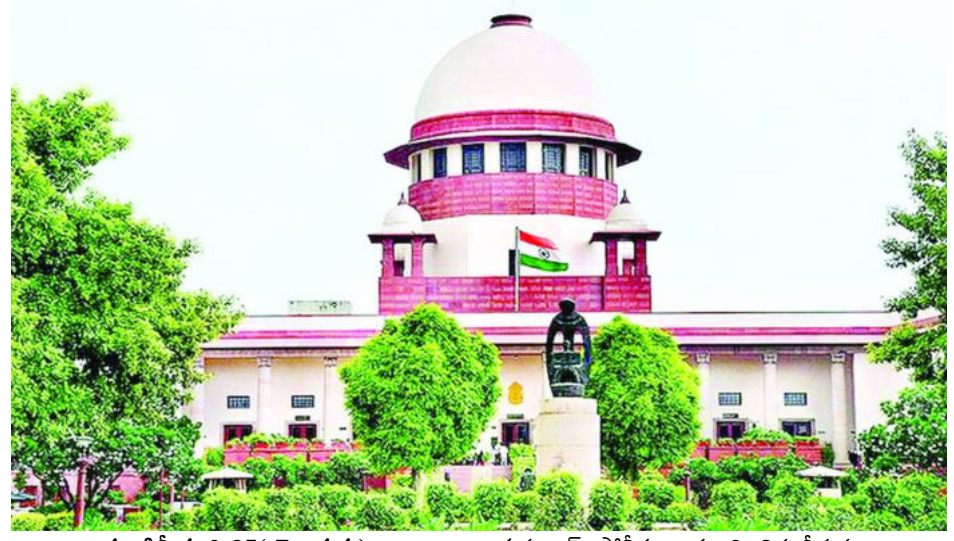
న్యూఢిల్లీ,మార్చి25( వెలుతురు): నాలుగేళ్ల బాలికపై జరిగిన అత్యాచారం కేసులో గురుగ్రామ్ పోలీసులు స్పందించిన తీరును సర్వోన్నత న్యాయస్థానం తీవ్రంగా తప్పుపట్టింది. ఆ