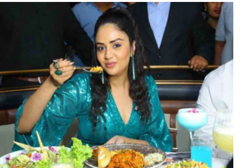
వచ్చి ప్రశాంతంగా గడిపేలా, ఒక మంచి అనుభూతిని అందించేలా పుర్లోను తీర్చిదిద్దినట్లు ఆమె వివరించారు. సోషల్ మీడియా మార్కెటింగ్ ఈ రెస్టారెంట్లో సుమారు 300 మంది కూర్చునే