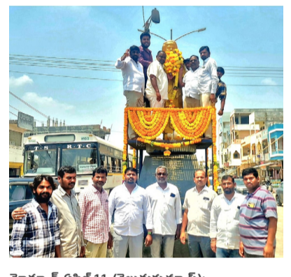
మోత్యూర్, ఏప్రిల్ 11, (వెలుతురు న్యూస్):