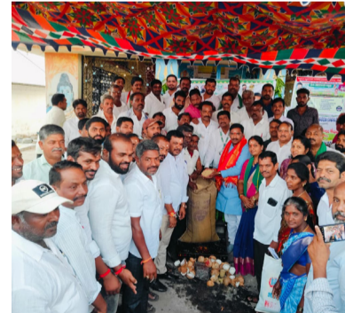
*ప్రభుత్వ బిస్ ఆలేరు ఎమ్మెల్యే బీర్ల బలయ్య