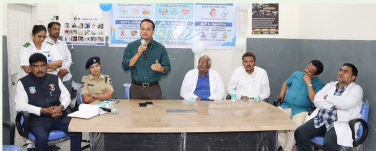
వ్యవసాయ పరిశోధనా సంస్థానాన్ని నిర్మించండి కామారెడ్డి జిల్లా ప్రతినిధి (వెలుతురు) ఏప్రిల్ 11