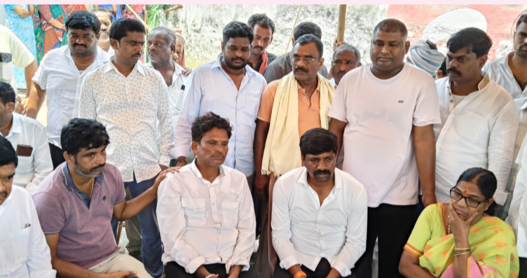
నార్యట్ పల్లి వెలుతురు ఏప్రిల్ 11: