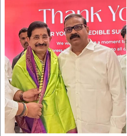
తెలిపిన సెటిల్మెంట్లపై కఠిన చర్యలు తీసుకోండి