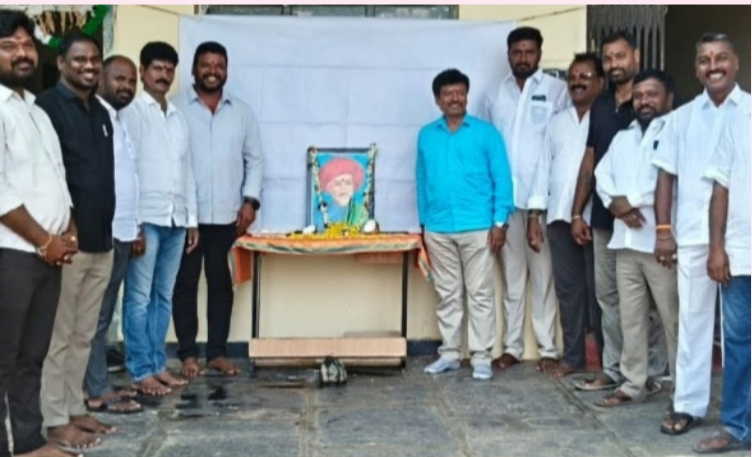
నార్యట్ పల్లి వెలుతురు ఏప్రిల్ 11: