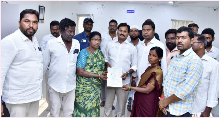
భువనగిరి ఏప్రిల్ 11 (వెలుతురు న్యూస్):

22వ వార్షిక పరిధిలోని ఇందిరా నగర కమిటీని బలపరచుతూ గతంలో అనారోగ్యంతో హాస్పిటల్ లో చేరి వైద్య యోగ్యత కోసం ఉన్న దానిని సందర్శించి ఈరోజు సానిటరీ క్యాంప్ లో విశ్రాంతిని పొందే వారికి 22000/హామీలను చెక్కు