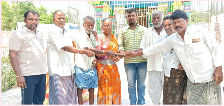
నార్యట్ పల్లి వెలుతురు ఏప్రిల్ 11:

విల్పాల మండలం వనిపాకల గ్రామంలో ఏప్రిల్ 20, మరియు 21, తేదీలలో జరగబోయే శ్రీ జమదగ్ని రేణుక ఎల్లమ్మ కళ్యాణం కార్యక్రమానికి దుబ్బా పార్కు రహదారి ద్వారా 20,116/ రూపాయల విరాళం అందజేశారు.