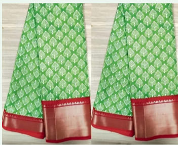
తయారీ పూర్తి చేసి, నవంబర్ 19న అందిరాగాండ్ జయంతి సందర్భంగా పంపిణీ చేయాలని ప్రభుత్వం లక్ష్యంగా పెట్టుకుంది.

తెలంగాణలో ఉచిత చీరల పంపిణీ పథకాన్ని ఈ ఏడాది కూడా కొనసాగించాలని ప్రభుత్వం నిర్ణయించింది. ఈసారి చిలకపచ్చ రంగుతో, ఎరుపు జరిగిన తర్వాత కొత్త చీరలను మహిళలకు అందించనున్నారు. కోటి చీరల తయారీకి బెస్కోకు రూ. 450 కోట్ల ఆర్డర్ ఇచ్చారు. గతంలో నీలం రంగు చీరలు ఇవ్వగా, ఈసారి కొత్త రంగును ఎంపిక చేశారు. గామీ, పట్టణ ప్రాంతాల వారికి ఒకేసారి పంపిణీ చేయనున్నారు. అక్షోభ నాటికి