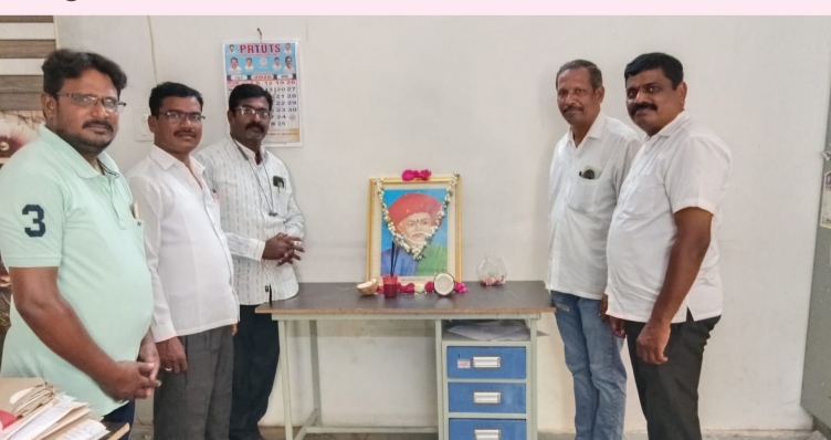
మోత్యూర్, ఏప్రిల్ 11, (వెలుతురు న్యూస్):

అంటరానితనం, కులవ్యవస్థ నిర్మూలనతో పాటు మహిళోద్ధరణకు కృషి చేసి, మహిళా విద్యకు పాటుపడిన మహాత్మా జ్యోతిరావు పూలే 119వ జయంతి వేడుకలను మోత్యూరు తహ