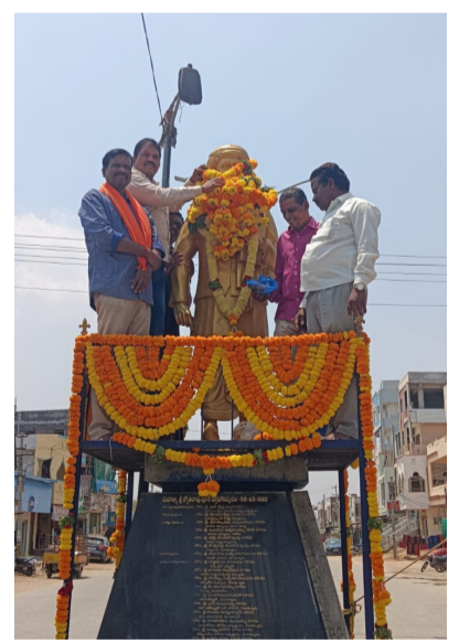
• మోత్యూర్, ఏప్రిల్ 11, (వెలుతురు న్యూస్):