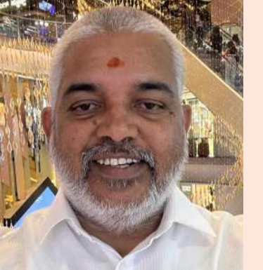
ఎన్ని రోజులు సరిపోతాయి? ఎందుకు ప్రజలకు నిజం చెప్పడం లేదు? మిత్రులారా...

మిత్రులారా ఇది సాధారణ సమస్య కాదు! ఇది దేశాన్ని కుదిపేస్తున్న సంక్షోభం! ఈ రోజు మన దేశంలో పరిస్థితి ఏంటి? పెట్రోల్ లేదు, డీజిల్ లేదు, గ్యాస్ లేదు, ప్రజలు బంకుల దగ్గర తిరుగుతున్నారు, కానీ చేతిలో ఖాళీ బాటిల్ తప్ప ఇంకెంలేదు! ప్రతి రోజూ తమ వాహనాల్లో గంటల తరబడి పెట్రోల్ బంకె ల దగ్గర నిలబడినా దొరకని పరిస్థితి చివరికి పెట్రోల్ బంకుల దగ్గర ట్రాఫిక్ జామ్, ఇది ఎవరి వైఫల్యం? ఇది కేంద్ర ప్రభుత్వ వైఫల్యం కాదా?