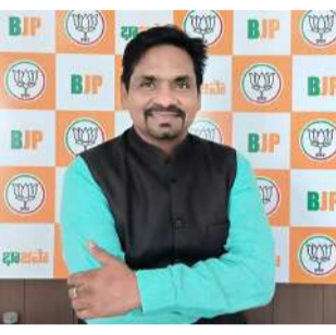
40 పైగా దేశాల నుంచి ముడిచమురు తెప్పిస్తున్నారని చెప్పారు. 2022 నుండి జరుగుతున్న యుక్లెన్ రష్యా యుద్ధం ఇప్పుడు జరుగుతున్న ఇరాన్ ఇజ్రాయిల్ అమెరికా యుద్ధాల కారణంగా ప్రపంచంలో అనేక దేశాలు ఇంధన విషయంలో అనేక ఇబ్బందులు పడుతున్నారని ఆయన దేశాలలో ఇంధన ధరలు పెంచబోమని స్పష్టం చేశారు. అయితే 23 వ తారీఖున విడుదల చేసిన ప్రకటనలో పెట్రోల్ డీజిల్ ధరలను ఎట్టి పరిస్థితుల్లో పెంచబోమని స్పష్టం చేశారని ఆయన స్పష్టం చేశారు. కొంతమంది పనికట్టుకుని ఉపకార్య స్థానిక ప్రజల్లో భయాందోళనలు రేకెత్తించి తద్వారా వారి బంబు గడుపుకోవాలని చూస్తున్నారని ఇటువంటి అసాంఘిక శక్తులపై ప్రభుత్వం తక్షణమే చర్యలు తీసుకోవాలని రవికిరణ్ డిమాండ్ చేశారు. పశ్చిమాసియాలో జరుగుతున్న యుద్ధం కారణంగా ముడిచమురు భారత్ కి వస్తున్న ఓడల సంఖ్య కొంత తగ్గిన మాటలను ఆయన పుటికిరణ్ భారత్ దేశంలో కాబలసిన నిల్వలు ఉన్నాయని అలాగే ప్రధాని మోడీ గారు

గ్రహించాలని రవికిరణ్ విజ్ఞప్తి చేశారు. ఒక బ్యాంకు దగ్గరకి ఖాతాదారులు అందరూ ఒకేసారి వచ్చి డబ్బులు డ్రా చేసుకోవటానికి ప్రయత్నిస్తే ఆ బ్యాంక్ తాళాలు వేసుకోవలసిన పరిస్థితి వస్తుందో అదే రకంగా అవసరానికి మించి ఇంధనాన్ని కొనుగోలు చేయటం వదిలిపెడితే దానికి అంతం ఉండవని ఇప్పుడున్న ప్రపంచ పరిస్థితుల్లో సమస్యని మరింతగా పెంచిన వాళ్ళు అవుతామని రవికిరణ్ విజ్ఞప్తి చేశారు. గడచిన ఏడాది కన్నా ఇప్పుడు అమ్మకాలు 30% పైబిలుకు పెరిగిపోయాయని ఇలాగే కొనసాగిస్తే పరిస్థితి చేయి దాటి పోతుందని, దయచేసి విజ్ఞప్తి ప్రజలు అయిదేసి ప్రజల్లో చైతన్యం కలిగించాలి. లారీలు బస్సులు, కార్లు టూటిల్లర్ల వీటికి “కోటా” విధించి అంతకుమించి అమ్మకం అధికారులు చర్యలు తీసుకోవాలి అన్నారు. పెట్రోల్ డీజిల్ కూడా పూర్తిగా సహకరించాలని రవికిరణ్ కోరారు. ప్రస్తుతం ఉన్న పరిస్థితుల్లో అవసరం కన్నా ఎక్కువ పెట్రోల్ డీజిల్ కొనుగోలు చేసి నిల్వలు చేయటం మొదలుపెడితే దేశానికి మనం మంచి కన్నా చెడు ఎక్కువ చేసిన వాళ్ళం అవుతామని ఈ సునిత అంశాన్ని ప్రజలు