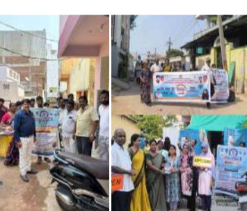
బీసీ/మైనారిటీ ASCDO/ASWO/ATWO/హాస్టల్ సంక్షేమ అధికారులు మరియు నిబ్బంది పర్యవేక్షణలో నిర్వహించబడింది. 7వ రోజు కార్యక్రమం విజయవంతంగా నిర్వహించబడింది మరియు ఖాళీలను భర్తీ చేయడానికి, అర్హులైన విద్యార్థులందరికీ హాస్టల్ మరియు ఆశ్రమ పాఠశాల సౌకర్యాలు అందేలా చూడటానికి ప్రత్యేక ప్రయత్నాలు జరిగాయి.