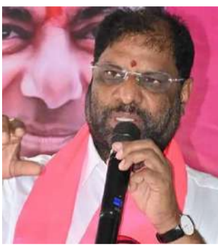
టరీ స్టాయా సంఘం సభ్యులు ఎంపీ