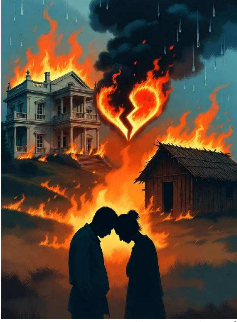
చెందుతుంది. ఇది ఒక వ్యక్తిగత దుఃఖాన్ని సామాజిక సత్యంగా మార్చిన తీరు ప్రశంసనీయం. ఒక చిన్న వాక్యంలో ఇంతటి గాంధీ రాష్ట్రాన్ని నింపడం అనేది తెలుగు సినీ కవుల ఓ

శాస్త్రం ప్రకారం, మనిషి తీవ్రమైన ట్రామా (Trauma) లేదా దుఃఖంలో ఉన్నప్పుడు అతని మెదడు భావ్య ప్రపంచంలోని విలాసాలను గుర్తించే స్థితిలో ఉండదు. దీనినే Emotional anhedonia అని కూడా అనవచ్చు. అంటే తీవ్రమైన బాధలో ఉన్నప్పుడు ఏ సౌకర్యమూ అనందాన్ని ఇవ్వదు. కవి ఈ శాస్త్రీయ సత్యాన్ని అతి తక్కువ పదాలలో, సామాన్యుడికి అర్థమయ్యే రీతిలో మేడ, గూడు ఒకటే అని తెల్పి చెప్పారు. మన ప్రాచీన వేదాంతం ప్రకారం, ఈ శరీరం ఒక గూడు వంటిది. ఆత్మ పరమాత్మలో లీనమవ్వాలని తపిస్తుంది. భౌతికమైన సంపదలు (మేడలు) తాత్కాలికమైనవని, మృత్యువు లేదా తీవ్ర వేదన ముందు ఇవన్నీ దిగి పడిపోతాయి అంటే వైదాగ్యం కలిగిన స్థితి అని కూడా అనుకోవచ్చు. ఆ స్థితిలో ఉన్న వ్యక్తికి ప్రాపంచిక భేదాలు కనిపించవు. తెలుగు వారు భావోద్వేగాలకు అధిక ప్రాధాన్యతనిస్తారు. మన జానపద గేయాల నుండి ఆధునిక కవిత్వం వరకు కన్నీరు, కష్టం అనే అంశాలు మనిషిని మనిషిగా మార్చే క్రియలుగా వర్ణించబడ్డాయి. ఈ చరణం తెలుగు వారి హృదయంలో ఎందుకు అంతగా నాటుకుపోయిందంటే, ఇది మన సంస్కృతిలోని సహానుభూతి (Empathy) అనే గుణాన్ని తట్టి లేపుతుంది. ఎదుటివాడి బాధను చూసి, వాడు ధనవంతుడే లేక పేదవాడే అని చూడకుండా, వాడు కూడా మనలాంటి మనిషే అని గుర్తించేలా చేస్తుంది. శ్రీశ్రీ, అత్తయి, వేటూరి వంటి మహానుభావులు సమాజంలోని పీడిత వర్గాల గురించి, మానవ నైజం గురించి ఎన్నో అద్భుతాలు రాశారు. ఈ చరణం కూడా ఆ కోవకే