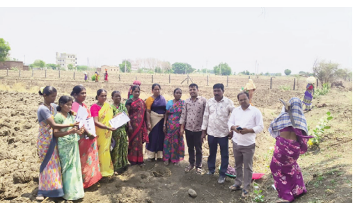
మట్టి పరీక్షల ప్రాముఖ్యతపై నిపుణుల వివరణ....

రైతులకు ప్రాయోగిక శిక్షణ... జహీరాబాద్ వెలుతురు ఏప్రిల్ 15: సంగారెడ్డి జిల్లా రురూసంగం మండలం బొప్పన్నపల్లి, కక్కిరవాడ మరియు రురూసంగం గ్రామాలలో డి.డి.యస్.ఉకేపివీ ఆధ్వర్యంలో భూమి సుపరిషత్, సంరక్షణ మరియు సమతుల్య ఎరువుల యాజమాన్యంపై అవగాహన కార్యక్రమం నిర్వహించారు. ఈ కార్యక్రమంలో రైతులకు మట్టి ఆరోగ్యం, ఎరువుల వినియోగం, పంటల నిర్వహణపై నిపుణులు విస్తృతంగా మార్గదర్శనం చేశారు. ఈ సందర్భంగా డి.డి.యస్.ఉకేపివీ భూసార పరీక్ష నిపుణులు ఈ స్వామి మాట్లాడుతూ మట్టి పరీక్షల ప్రాముఖ్యతను వివరించారు. పొలాల నుండి మట్టి సమూహాలను సరైన విధంగా ఎలా సేకరించాలి, ఏ సమయంలో తీసుకోవాలి వంటి అంశాలపై రైతులకు అవగాహన కల్పించారు. మట్టి పరీక్షల ద్వారా భూమిలోని పోషక విలువలు, ఉదజని సూచిక (జిఎన్), నీటిలో కరగి లవణాల శాతం, సేంద్రియ కార్బన్ స్థాయి