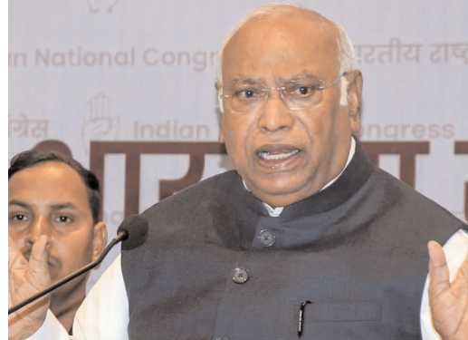
వేకుల్లో ఉండాలిని అధికారాన్ని ఎప్పుడైనా డీలీమిటేషన్ మార్చుకునే వీలుగా వారు తమ చేతుల్లోకి తీసుకున్నారు. అసో, జమ్మూకశ్మీర్లో వారు ఇప్పటికే మమ్మల్ని మోసం చేశారు."

నిర్ణయించారు. 2010 నుంచి 2023 వరకు రాజ్యాంగ సవరణకు అంగీకరించాం. పాత సవరణలనే అమలు చేయాలని కోరుతున్నాం. నియోజకవర్గాల పునర్విభజన(డీలీమిటేషన్) విషయంలో వారు (ప్రభుత్వం) కొన్ని గొప్పిళ్లు చేస్తోంది. పార్టీలన్నీ ఏకతాటిపై నిలిచి పార్లమెంటులో ఐక్యంగా పోరాడాలి. మేం ఈ బిల్లును వ్యతిరేకిస్తాం, కానీ మహిళా రిజర్వేషన్లకు మేం వ్యతిరేకం కాదు. ఈ బిల్లులో వారు పొందుపరిచిన విధానం మాస్టే కనీసం జనాభా లెక్కల ప్రకారం కూడా పూర్తి చేయకుండానే డీలీమిటేషన్ అంశాన్ని చేర్చారు. రాష్ట్రాంగ అధికారాలన్నింటినీ కాల్చివేస్తూ వ్యవస్థ తన గుప్పిట్లోకి తీసుకుంటోంది. ప్రధానంగా వ్యవస్థలు, పార్లమెంటు