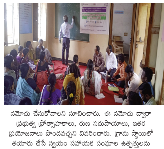
నమోదు చేసుకోవాలని సూచించారు. ఈ నమోదు ద్వారా ప్రభుత్వ ప్రోత్సాహాలు, రుణ సదుపాయాలు, ఇతర ప్రయోజనాలు పొందవచ్చని వివరించారు. గ్రామ స్థాయిలో తయారు చేసే స్వయం సహాయక సంఘాల ఉత్పత్తులను

స్వయం సహాయక సంఘాల ఆర్థికాభివృద్ధికి ఆన్లైన్ మార్కెటింగ్పై దృష్టి పెట్టాలి... నిపుణుల సూచనలు జహీరాబాద్ వెలుతురు ఏప్రిల్ 15: సంగారెడ్డి జిల్లా కోహార్ మండల మహిళా సమాఖ్య ఆధ్వర్యంలో ఈరోజు ఉద్యమ ఆధార్ నమోదు (ఖనము) సామర్థ్యముతో =వస్త్రఅరేషియేటివ్) పై అవగాహన మరియు శిక్షణ కార్యక్రమం నిర్వహించారు. ఈ కార్యక్రమం ద్వారా స్వయం సహాయక సంఘాల (సా+ఓ) మహిళలకు వ్యాపార అవకాశాలు, ఆర్థికాభివృద్ధి మార్గాలు, ప్రభుత్వ పథకాల వినియోగంపై విస్తృతంగా అవగాహన కల్పించారు. ఈ సందర్భంగా నిపుణులు మాట్లాడుతూ, చిన్న వ్యాపారాలు నిర్వహిస్తున్న మహిళలకు తప్పనిసరిగా ఉద్యమ ఆధార్