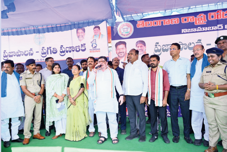
నిజామాబాద్, వెలుతురు ఏప్రిల్ 15 : నిర్వహించిన కార్యక్రమంలో పాల్గొన్న అధికారులు