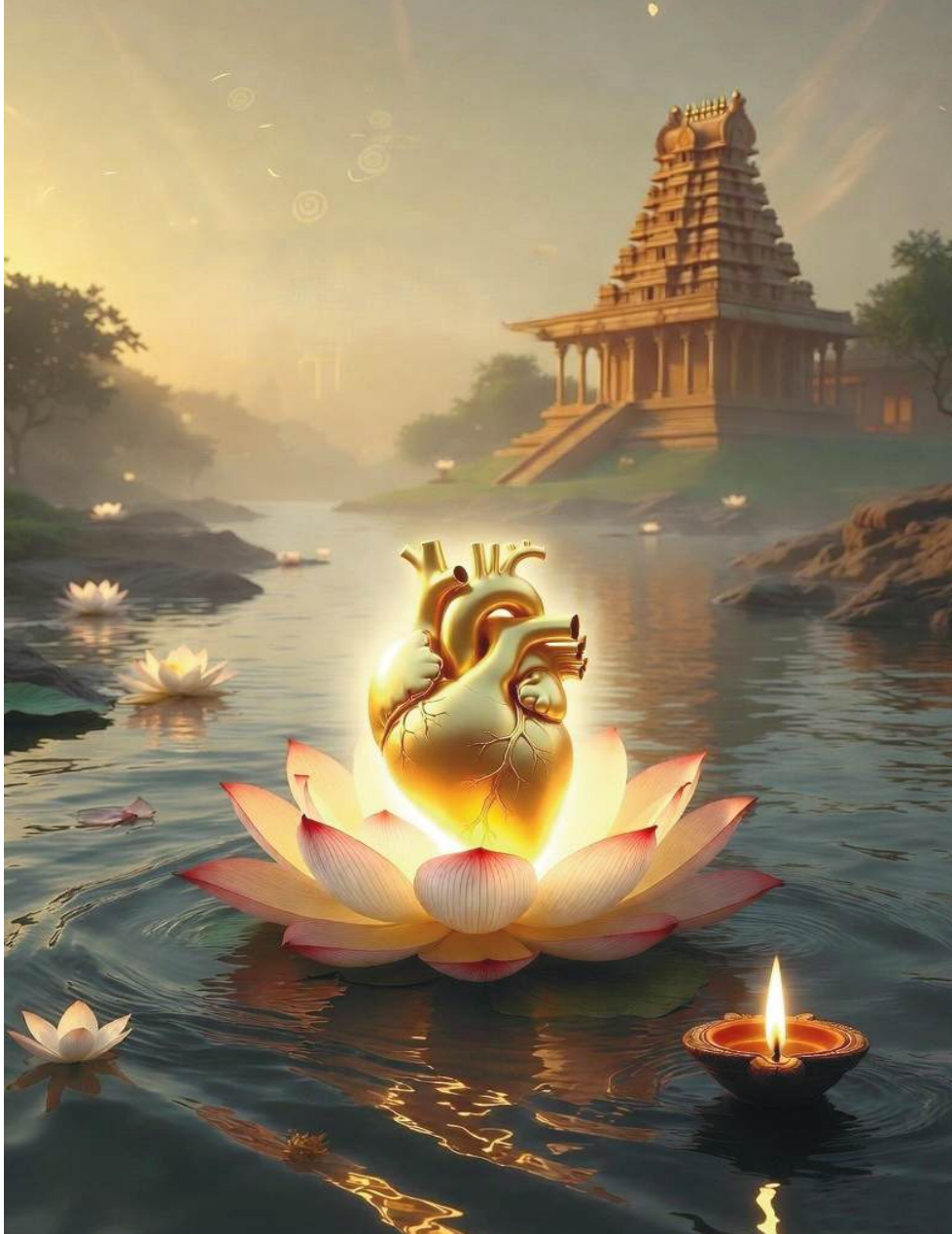
మనసాక్షి ఆ క్షణాన ఉన్న క్లిష్టతను అర్థం చేసుకుంటుంది. ఉదాహరణకు, సత్యం వలకడం వరమ ధర్మం అని శాస్త్రం చెబుతుంది. కానీ, ఒక క్రూర మృగం నుండి ఒక సాధు జంతువును కాపాడటానికి అబద్ధం చెప్పాల్సి వస్తే, అక్కడ

మానవ జీవితం ఒక నిరంతర ప్రయాణం. ఈ ప్రయాణంలో మనకు అడుగుడుగునా ఎదురయ్యే ప్రశ్ననేను చేస్తున్నది సరైనదేనా? ఈ సరైనది అనే భావనే ధర్మం. అయితే, ఈ ధర్మాన్ని నిర్ణయించేది ఎవరు? మన గుండె లోతులోంచి వినిపించే మనసాక్షి స్వరమా? లేక యుగయుగాలుగా మనకు దిశనిర్దేశం చేస్తున్న శాస్త్ర గ్రంథాలా? ఈ మీమాంస నేటిది కాదు, ఇది సనాతనమైనది. మరియు నిత్యనూతనమైనది. మనసాక్షిని ఆంగ్లంలో 'Conscience' అంటారు. ఇది ఒక వ్యక్తి యొక్క నైతిక దిక్సూచి.