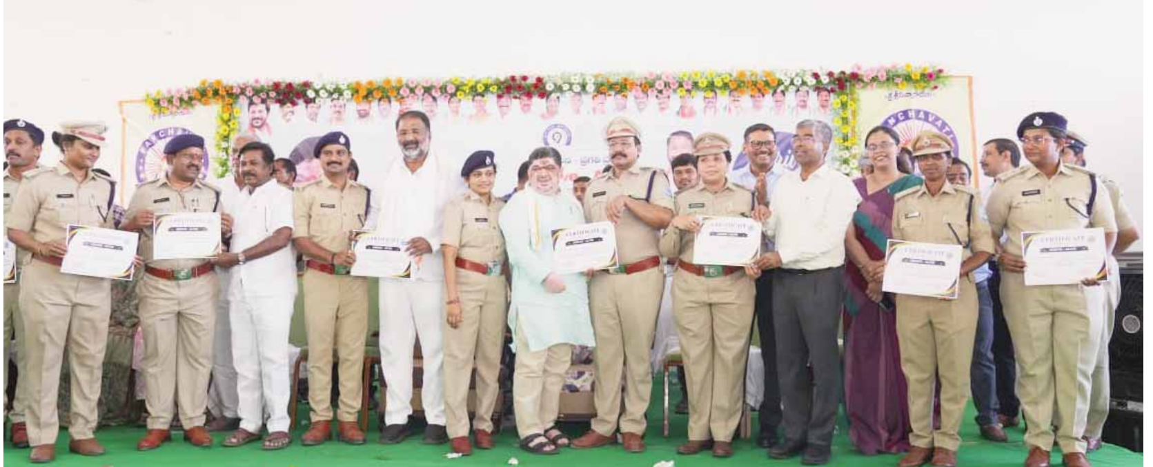
ప్రజా పాలన ప్రగతి ప్రణాళిక 99 రోజుల కార్యచరణ లో భాగంగా మహబూబ్ నగర్ జిల్లాలో అరైవ్ అరైవ్ కార్యక్రమంలో పాల్గొన్న మంత్రులు పాన్నం ప్రభాకర్, వాకిటి శ్రీహరి