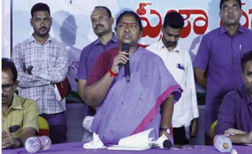
ప్రజలతో మమేకమై ప్రజా దర్బార్ కార్యక్రమం. గ్రామ సమస్యలను గ్రామంలోనే సత్వరమే పరిష్కరించే విధంగా ఆదేశాలు. రాష్ట్ర పంచాయతీరాజ్, గ్రామీణాభివృద్ధి, గ్రామీణ నీటి సరఫరా, మహిళా, శిశు సంక్షేమ శాఖ మంత్రి శ్రీమతి దనసరి అనసూయ సీతక్క