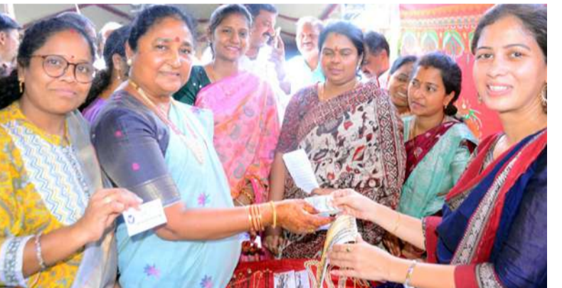
దని చెప్పారు. గత బిఆర్ఎస్ ప్రభుత్వం ఒక్క రేషన్ కార్డు కూడా మంజూరు చేయలేదని విమర్శించారు. కాంగ్రెస్ ప్రభుత్వం అధికారంలోకి రాగానే అర్జులైన పేదలందరికీ కొత్త రేషన్ కార్డులను మంజూరు చేసేదని పేర్కొ