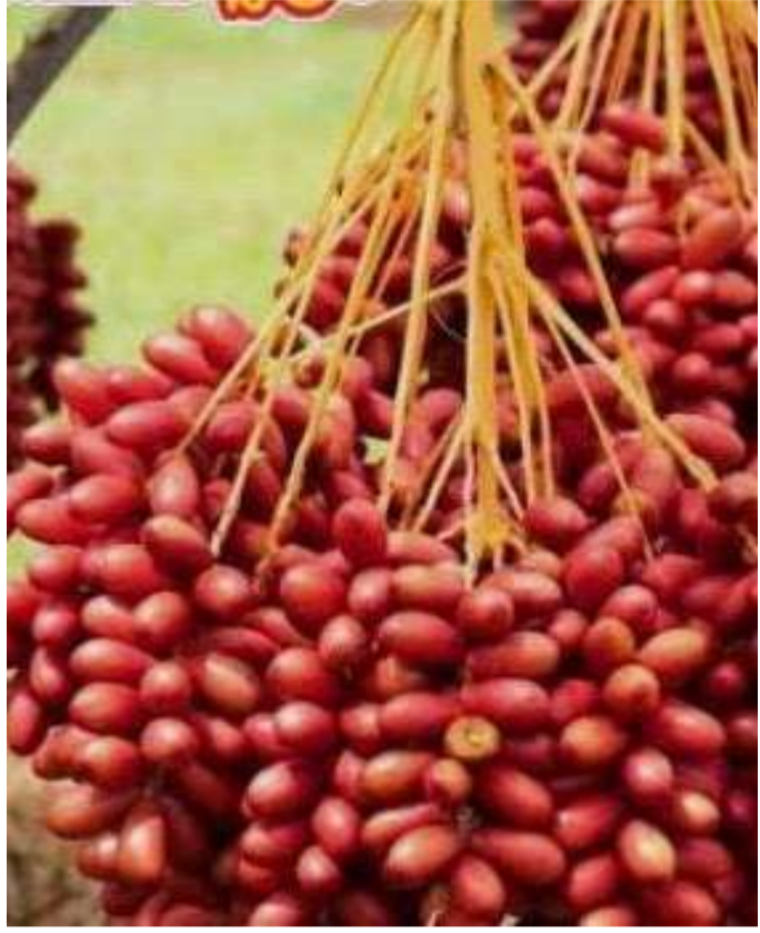
హైదరాబాద్ వెలుతురు మే 2:

వేసవి కాలం వచ్చిందంటే చాలా పళ్లెటూళ్లలో కనువిందు చేసే ప్రకృతి ప్రసాదం ఈతపళ్ళు. కామాయం మరియు ఎరుపు రంగు కలగలుపుతో ఆకర్షణీయంగా కనిపించే ఈ పళ్ళు కేవలం రుచితో కాకుండా, అద్భుతమైన పోషక విలువలకు నిలయం. వీటిలో సమృద్ధిగా ఉండే క్యాలియం ఎముకలను దృఢంగా ఉంచడమే కాకుండా, ఐరన్ శాతం పల్ల రక్తహీనత (ఎనీమియా) సమస్యను దూరం చేసే రక్తవృద్ధికి తోడ్పడుతుంది. కేవలం పండుగానే కాకుండా, వీటితో తాండ్లను తయారు చేస్తారు. బెంగాల్ వంటి ప్రాంతాల్లో ఈత చెట్ల నుండి బెల్లాన్ని కూడా తయారు చేయడం విశేషం. ఈతపళ్ళలో ఉండే గ్లూకోజ్, సుక్రోజ్, ఫ్రక్టోజ్ వంటి చక్కెరలు శరీరానికి తక్షణ శక్తిని అందించి వేసవి అలసటను, నిస్సత్తువను దూరం చేస్తాయి. జీర్ణశక్తిని పెంపొందించి మలబద్ధకం, కడుపునొప్పి వంటి జీర్ణ సంబంధిత రుగ్మతలను