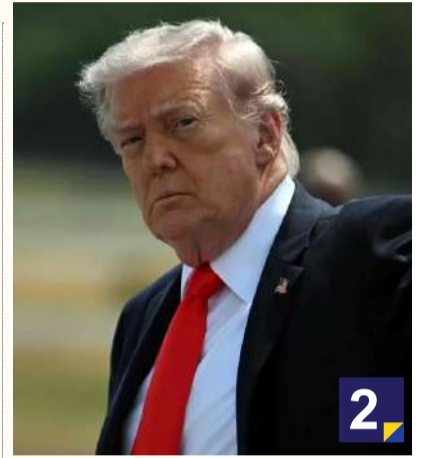
అమెరికా వెలుతురు మే 02:

అంతర్జాతీయ రాజకీయాల్లో అమెరికా అధ్యక్షుడు డొనాల్డ్ ట్రంప్ మరోసారి తనదైన శైలిలో 'సంచలన వ్యాఖ్యలు' చేశారు. తాము ఒక రకంగా 'సముద్రపు దొంగల' (ప్రైవేట్) లాంటి వాళ్లమేనని, అయితే తాము వెనకాముందు ఆలోచించకుండా పని పూర్తి చేస్తామని ఆయన వ్యాఖ్యానించారు. గల్ఫ్ జలాల్లో ఇరాన్ కు చెందిన చమురు నౌకను అమెరికా నౌకాదళం సీజ్ చేసిన నేపథ్యంలో ట్రంప్ ఈ వ్యాఖ్యలు చేయడం ప్రాధాన్యత సంతరించుకుంది. ఛోరీదాలో జరిగిన ఒక కార్యక్రమంలో ఆయన మాట్లాడుతూ.. చమురు నౌకను సీజ్ చేయడం తమకు దక్కిన అతిపెద్ద లాభదాయక వ్యాపారమని అభివర్ణించారు. ..మిగతా 2లో