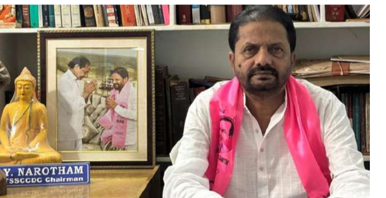
లోనే గ్యాస్ సిలిండర్ ధరను రూ.1300కు పైగా పెంచడం దారుణమని అన్నారు.

కమర్షియల్ గ్యాస్ సిలిండర్ ధరలను ఒక్కసారిగా సుమారు రూ.1000 వరకు పెంచడం వల్ల సామాన్య ప్రజలపై తీవ్ర భారం పడిందని ఎస్సీ కార్పొరేషన్ మాజీ చైర్మన్ వై. నరోత్తం విమర్శించారు. ముఖ్యంగా హోటల్ యజమానులు, చిన్న చిన్న వీధి వ్యాపారులు ఈ పెంపుతో తీవ్రమైన ఇబ్బందులు ఎదుర్కొంటున్నారని తెలిపారు. ఎన్నికలు ముగిసిన వెంటనే కేంద్ర ప్రభుత్వం ఈ నిర్ణయం తీసుకోవడం ప్రజలను మోసం చేసినట్లనే అయిన ఆరోపించారు. కేవలం రెండు నెలల వ్యవధి