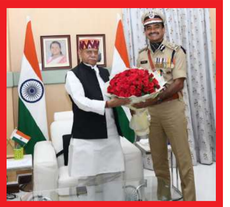
తెలంగాణ నూతన డిజిటింగ్ బాధ్యతలు స్వీకరించిన సీఎం ఆనంద్ లోక్భవన్ లో గవర్నర్ శివ్ ప్రతాప్ శుక్లాను మర్యాదపూర్వకంగా కలిశారు.