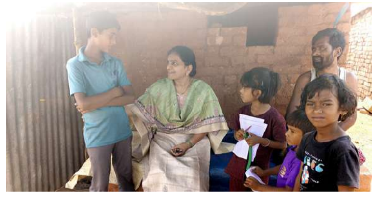
స్వయంగా పరిశీలించిన జడ్డి, అక్కడ ఉన్న పిల్లలు ఇటుకలను లారీలో చిన్నారలతో మాట్లాడి వారి పరిస్థితిని తెలుసుకున్నారు. పిల్లలు ఇటుకలను లారీలో ఎక్కించడంలో సహాయం చేస్తున్నారని