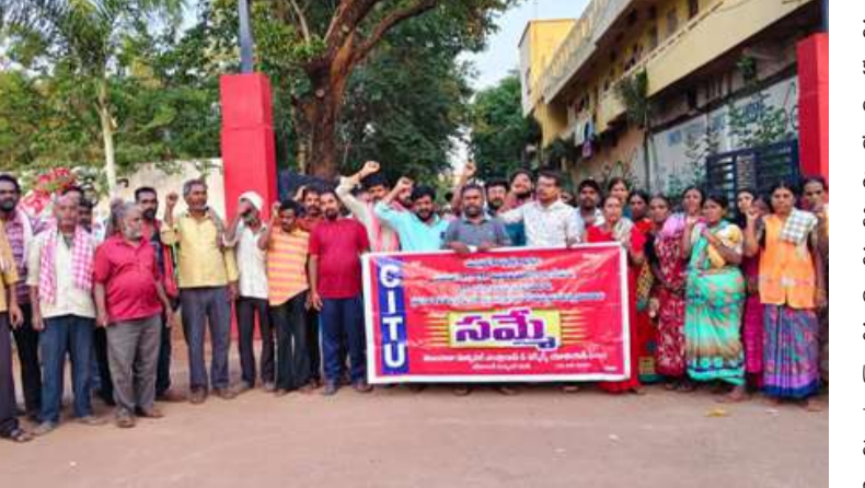
తున్నారని తెలిపారు. వెంటనే ఈ సమస్యను పరిష్కరించేందుకు అధికారులు చర్యలు తీ