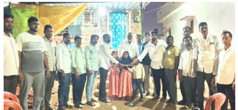
10వ తరగతి స్నేహితులు వెంటనే స్పందించి తమ మానవత్వాన్ని చాటుకున్నారు. తమకు తోచినంతగా విరాళాలు సేకరించి శుభవారం