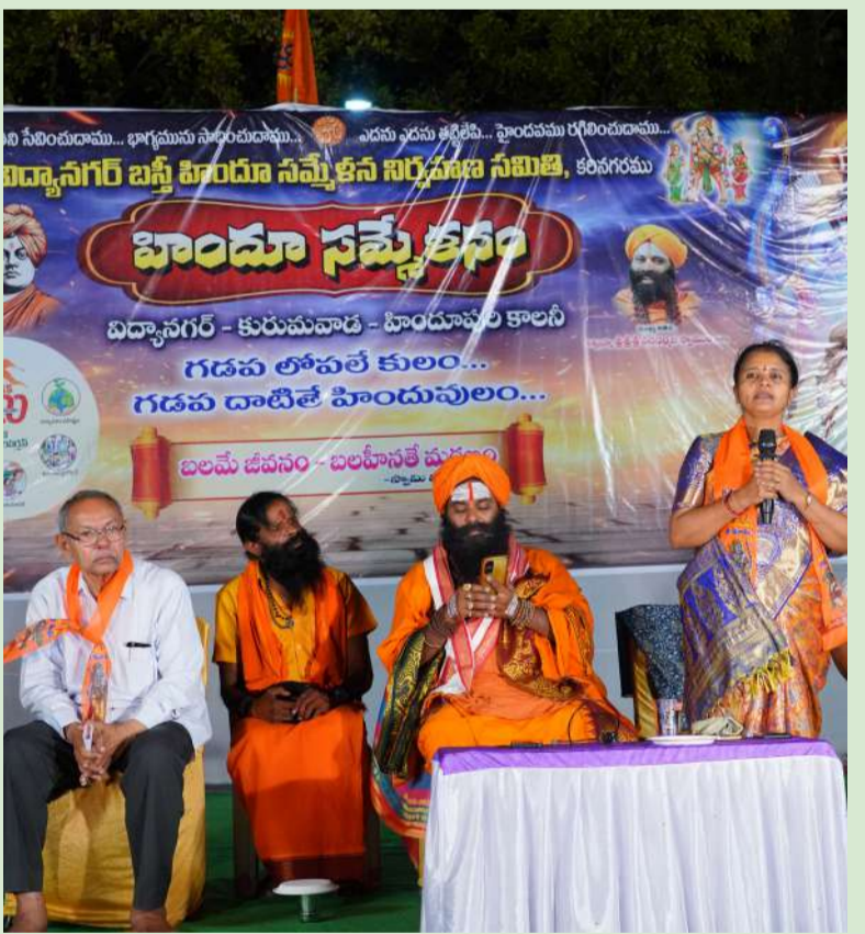
కరీంనగర్ వెలుతురు మే 02: