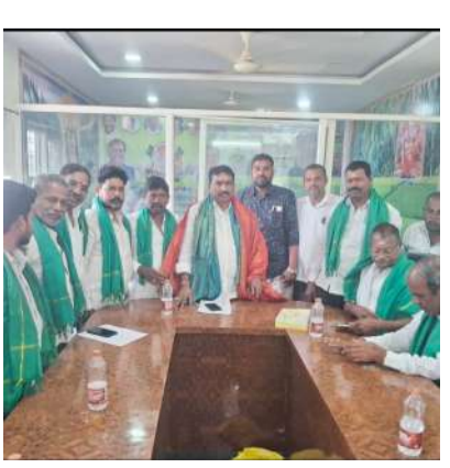
మంచాల వెలుతురు మే 06: