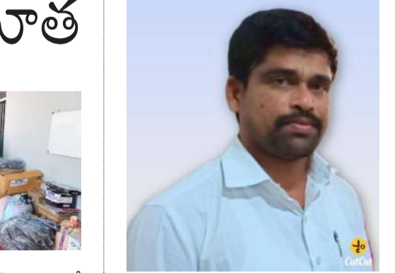
హైదరాబాద్ వెలుతురు మే 06:

దారు. ఆకలితో ఉన్నవారికి, అభ్యాసకులకు సేవ చేయాలనే సంకల్పంతో తాను, కొందరు మిత్రులతో కలిసి రిలయబుల్ ట్రస్టును స్థాపించి సేవా కార్యక్రమాలను నిర్వహిస్తున్నామని తెలిపారు. ప్రభుత్వ పాఠశాలల్లోని విద్యార్థులకు స్కూల్ కిట్లు, కందూల క్షీణిత, కుప్ప వ్యాధిగ్రస్తలకు కుటుంబాలకు నిత్యవసర సరుకులు, అనాధ ఆశ్రమాల్లోని పేద పోషణ కోసం నిత్యవసర సరుకులు, నూతన వస్త్రాలు, దుప్ప