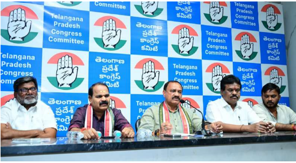
హైదరాబాద్ వెలుతురు మే 06: