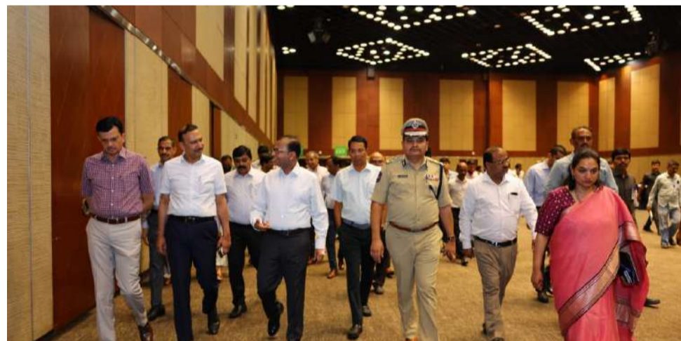
హైదరాబాద్ వెలుతురు మే 06:

భారత ప్రధాని సరేంద్ర మోదీ ఆదివారం (మే 10)న హైదరాబాద్ కు రానున్న నేపథ్యంలో భద్రతా ఏర్పాట్లపై సీపీఎస్ రామకృష్ణారావు వివిధ శాఖల ఉన్నతాధికారులతో సమీక్ష సమావేశం నిర్వహించారు. ఈ పర్యటన సందర్భంగా హైదరాబాద్ లోని ప్రధాన మార్కెట్ ట్రాఫిక్ నియంత్రణలు, అంక్షలు అమలు చేయడంతో పాటు భారీ బందోబస్తు ఏర్పాటు చేయనున్నారు.