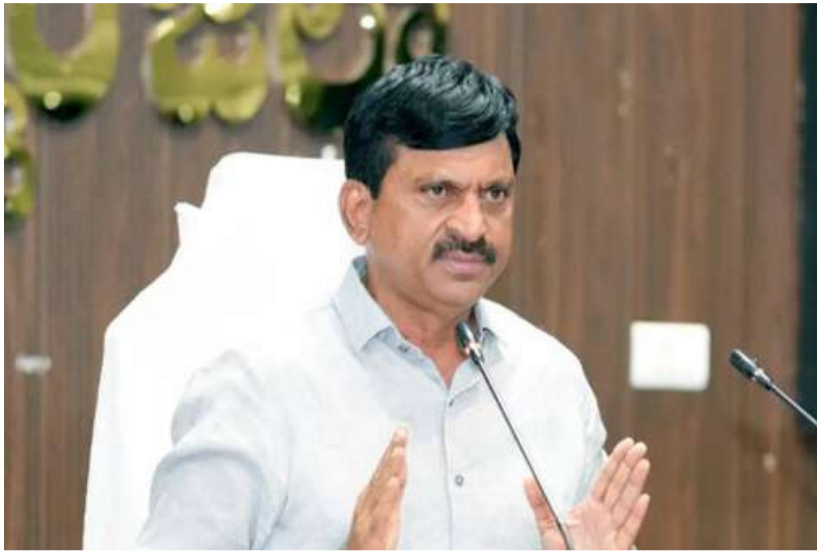
మంత్రి సృష్టించేవారు. ఆ సమావేశానికి రైతులు కాదు, కేవలం పార్టీ కార్యకర్తలే హాజరయ్యారని తెలిపారు. అధికారం కోల్పోయిన నిరాశలో కేటీఆర్ నోటికొచ్చిన విధంగా మాట్లాడి, తన స్థాయిని తానే దిగజారుతున్నారని విమర్శించారు. రైతుల ప్రాణాలతో ఆటలాడిన

అన్నారు. పదేళ్ల పాటు అధికారంలో ఉన్నప్పుడు రైతు సంక్షేమాన్ని విస్మరించి, నేడు రాజకీయ మైలేజీ కోసం మాటల దాడులకు దిగడం వారిని స్పృహతకు నిదర్శనమని మంత్రి విమర్శించారు. వరంగల్లో కేటీఆర్ చేసిన వ్యాఖ్యలు రైతు సంక్షేమంపై చింత కాదు, పూర్తిగా రాజకీయ నిరాశ, ఆక్రోశానికి ప్రతిబింబమని వ్యాఖ్యానించారు. కేంద్రంలోని బీజేపీతో కుమ్మక్కై, వారిపై ఈగ వాలనివ్వకుండా కాపాడుతూ... అన్నింటికీ రాష్ట్ర ప్రభుత్వాన్ని దోషిగా నిలబెట్టే ప్రయత్నం బీఆర్ఎస్ అసలు రాజకీయ స్వరూపాన్ని బయటపెడుతోందన్నారు. కేంద్రాన్ని ప్రశ్నించాలన్న చోట రాష్ట్రాన్ని లక్ష్యంగా చేసుకోవడం ప్రజలను తప్పుదారి పట్టించే ప్రయత్నమని బుద్ధవారం విడుదల చేసిన ఒక ప్రకటనలో ఈ సమావేశం మండిపడ్డారు. వరంగల్లో నిర్వహించిన సభను “రైతు సంగ్రామ సదస్సు”గా చెప్పడం పూర్తిగా అసత్యమని, అది అధికారం కోల్పోయిన బీఆర్ఎస్ పార్టీ ఆక్రోశ సభ మాత్రమేనని