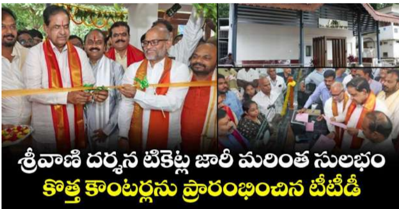
శ్రీవాణి దర్శన టికెట్ల బుకింగ్పై అపోహలు నమ్ముద్దు

విభాగం • సాఫ్ట్వేర్ను ఎప్పటికప్పుడు అప్డేట్ చేస్తూ భద్రతా చర్యలు • నకిలీ టికెట్ల విక్రయాలపై కఠిన చర్యలు తప్పవని హెచ్చరిక • భక్తులు కేవలం అధికారిక వెబ్సైట్ ద్వారానే బుకింగ్ చేయాలని విజ్ఞప్తి తిరుపతి వెలుతురు మే 13: తిరుపతి శ్రీవేంకటేశ్వర స్వామి దర్శనానికి సంబంధించిన శ్రీవాణి ట్రస్ట్ టికెట్ల బుకింగ్ విధానంపై సోషల్ మీడియా, కొన్ని పత్రికల్లో వస్తున్న వార్తలు, అనుమానాలు పూర్తిగా అవాస్తవమని తిరుపతి తిరుపతి దేవస్థానం (టీటీడీ) స్పష్టం చేసింది. భక్తులు ఎలాంటి అపోహలకు