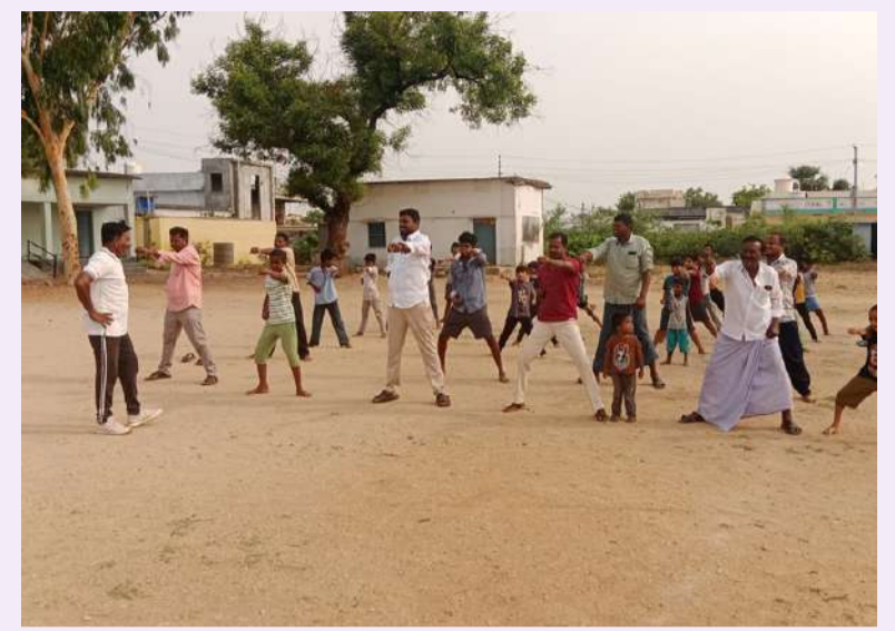
రామన్నపేట వెలుతురు స్టాన్ మే 15: ఇల్లా పరిషత్ ఉన్నత పాఠశాల స్కూల్ లో కరాటే సమ్మర్ క్యాంప్ ఉచిత కరాటే శిక్షణ క్లాస్ లు ప్రారంభించడం జరిగింది. గ్రామంలో గృహస్థులు, యువత, యువకులు, బాలురు, బాలికలు ఈ సందకాశాన్ని వినియోగించుకొని ఉచిత కరాటే శిక్షణ పొందాలని సర్కూల్ గృహస్థులు కోరారు.