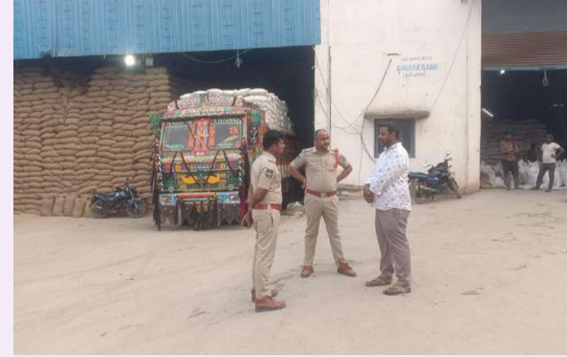
రామన్నపేట వెలుతురు స్టాన్ మే 15: స్థానిక ధాన్యం కొనుగోలు కేంద్రాలను ఆకస్మిక తనిఖీ చేశారు. ఈ సందర్భంగా గ్రామంలోని విద్యార్థులకు సాయం చేశారు.

స్థానిక ధాన్యం కొనుగోలు కేంద్రాలను ఆకస్మిక తనిఖీ చేశారు. ఈ సందర్భంగా గ్రామంలోని విద్యార్థులకు సాయం చేశారు.