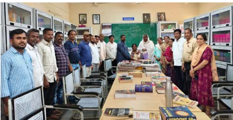
రామన్నపేట వెలుతురు స్టాన్ మే 15: స్థానిక ప్రభుత్వ డిగ్రీ కళాశాల రామన్నపేటలో ప్రజాపాఠశాల ప్రణాళికలో భాగంగా విద్యార్థులకు పుస్తకాలను పంపిణీ చేస్తున్నారు.

వారోత్సవాలను బడవ రోజుగా పుస్తక పఠనం చేయాలని ప్రోత్సహించింది. ఈ సందర్భంగా గ్రంథాలయంలో పుస్తక ప్రదర్శన, పుస్తకాల వితరణ, పుస్తక