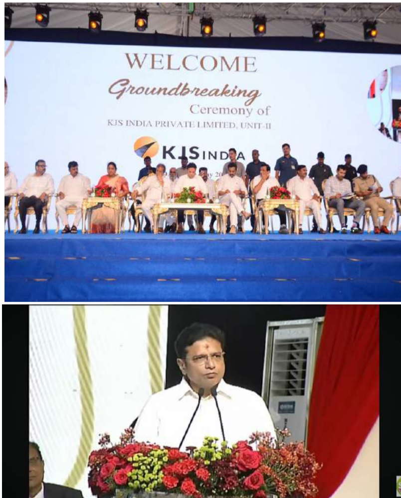
ఉందన్నారు. జిల్లాలో ఇంత పెద్ద స్థాయిలో పరిశ్రమ ఏర్పాటు చేస్తున్న కెజిఎస్ ఇండియా యూజి మాన్యూ అభినందించారు. పరిశ్రమలు పెద్ద ఎత్తున వస్తే స్థానిక యువతకు విస్తృత స్థాయిలో పరిశ్రమల స్థాపనకు అవసరమైన మౌలిక వసతుల కల్పనకు ప్రభుత్వం పూర్తి కట్టుబడి ఉందన్నారు. జిల్లాలో ఇంత పెద్ద స్థాయిలో పరిశ్రమ ఏర్పాటు చేస్తున్న కెజిఎస్ ఇండియా యూజి మాన్యూ అభినందించారు. పరిశ్రమలు పెద్ద ఎత్తున వస్తే స్థానిక యువతకు విస్తృత స్థాయిలో పరిశ్రమల స్థాపనకు అవసరమైన మౌలిక వసతుల కల్పనకు ప్రభుత్వం పూర్తి కట్టుబడి ఉందన్నారు.

స్థాపన ద్వారా స్థానిక యువతకు ఉపాధి అవకాశాలు కల్పించడమే ప్రభుత్వ లక్ష్యమన్నారు. రాబోయే రోజుల్లో తెలంగాణలో భారీ స్థాయిలో ఫుడ్ ప్రాసెసింగ్ హబ్ లు ఏర్పాటు కానున్నాయని తెలిపారు. ప్రపంచవ్యాప్తంగా ఫుడ్ ప్రాసెసింగ్ రంగం 9 ట్రిలియన్ డాలర్ల మార్కెట్ గా ఎదుగుతున్న సమయంలో తెలంగాణ కూడా ఈ రంగంలో ప్రత్యేక గుర్తింపు సాధించే దిశగా దుకొందన్నారు. జహీరాబాద్ ప్రాంతాన్ని కేంద్రంగా చేసుకొని నిమ్నజీను అతిపెద్ద పారిశ్రామిక కారిడార్ గా అభివృద్ధి చేస్తున్నామని చెప్పారు. భవిష్యత్తులో ఈ ప్రాంతం అంతర్జాతీయ పారిశ్రామిక కారిడార్ గా రూపుదిద్దుకుంటుందిని పేర్కొన్నారు. రాష్ట్రంలోని యువత నైపుణ్యాలను వినియోగించుకొని తెలంగాణను మరింత శక్తివంతమైన రాష్ట్రంగా తీర్చిదిద్దేందుకు ప్రభుత్వం కృషి చేస్తోందన్నారు. వ్యవసాయ ఆధారిత ప్రాంతాల్లో విలువ ఆదారిత పరిశ్రమలకు ప్రోత్సాహం అందిస్తున్నామని తెలిపారు. పరి, పాలు, పండ్లు, కూరగాయలు, పసుపు ఉత్పత్తుల్లో తెలంగాణ ముందంజలో ఉందని, వీటికి విలువను పెంచే ఫుడ్ ప్రాసెసింగ్ పరిశ్రమలు రైతులకు, యువతకు ఎంతో మేలు చేస్తాయని చెప్పారు. మంత్రి దామోదర రాజునంద్రం మాట్లాడుతూ ఉమ్మడి రాష్ట్రంలో అతిపెద్ద పారిశ్రామిక వాడగా పటాన్ చేరు గుర్తింపు పొందిందన్నారు. అదే తరహాలో వెనుకబడిన ప్రాంతాల్లో కూడా పరిశ్రమలు ఏర్పాటు చేసి యువతకు ఉద్యోగ అవకాశాలు కల్పించేలా పారిశ్రామికవేత్తలు ముందుకు రావాలని కోరారు. పరిశ్రమల స్థాపనకు అవసరమైన మౌలిక వసతుల కల్పనకు ప్రభుత్వం పూర్తి కట్టుబడి