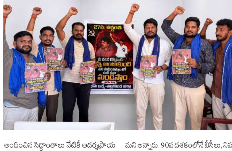
అందించిన సిద్ధాంతాలు నేటికీ ఆదర్శప్రాయమని అన్నారు. 90వ దశకంలోనే బీసీలు, నిమ్మ