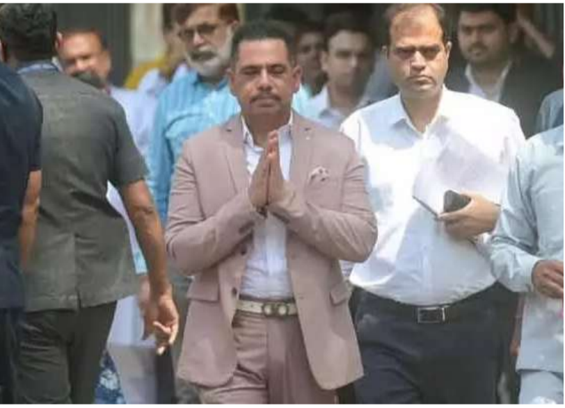
కరించడాన్ని సవార్ చేస్తూ వాడ్రా హైకోర్టును ఆశ్రయించారు. ఈ విజిట్ పై వాడ్రా తరఫున దేశంలోనే ప్రముఖ సీనియర్ న్యాయవాది అభిషేక్ మను సింఘ్ వాదనలు వినిపించారు. ఈ కేసులో మోక్షి అరోపణలన్నీ 2008 నుంచి 2012 మధ్య కాలానికి సంబంధించినవని ఆయన కోర్టు దృష్టికి తెచ్చారు. అప్పట్లో ఆయా భూ లావాదేవీల అంశాలు మనీలాండరింగ్ నిరోధక చట్టం (పీఎంఎల్ఏ) పరిధిలోకి రావని, ఆ తర్వాత ప్రభుత్వం చట్టాన్ని సవరించి వాటిని చేర్చిందని వివరించారు. చట్టం ప్రకారం పాత కేసులపై కొత్త నిబంధనలు వర్తింపజేయడం కు దరదని, అందుకే ఈ కేసు చట్టబద్ధతపైనే తమకు ఆభ్యంతరాలు ఉన్నాయని సింఘ్ వాదించారు.