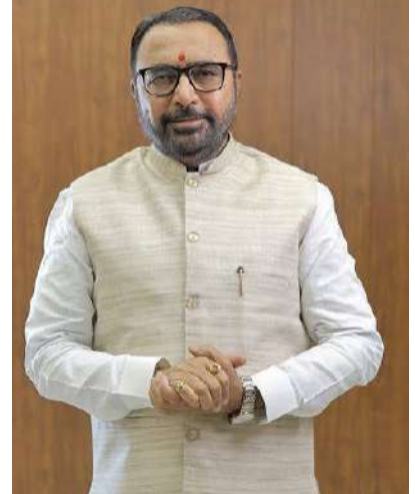
శ్రీ ప్రతాప్ రావ్ బాదర్

(రచయిత ఆయుష్ శాఖ సహాయ మంత్రి (స్వతంత్ర హోదా), ఆరోగ్యం, కుటుంబ సంక్షేమ శాఖ సహాయ మంత్రి)