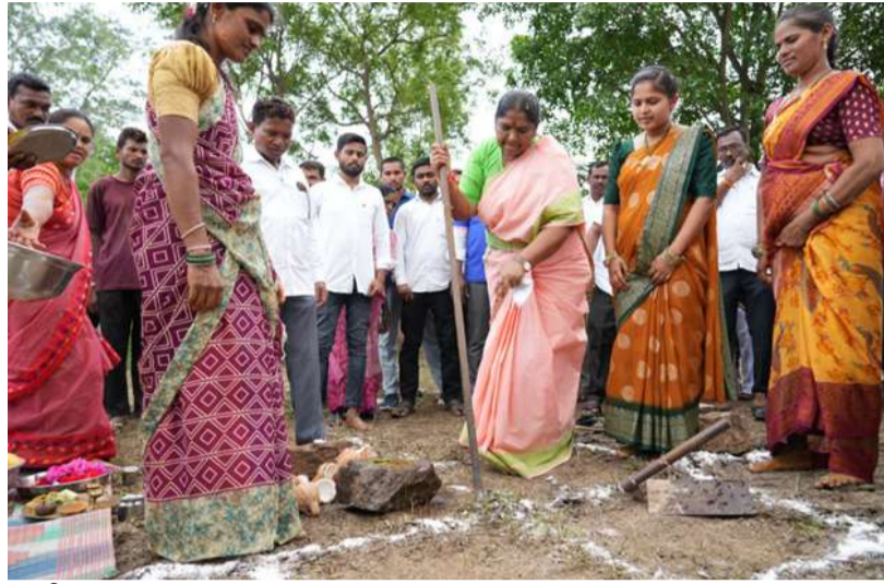
మే 25 నుంచి 31 వరకు రాష్ట్రవ్యాప్తంగా మహిళా వారోత్సవాలు