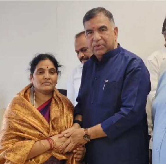
కోసం నిబద్ధతతో పనిచేస్తానని, గ్రామీణ సారాస్థానాన్ని పేర్కొన్నారు. ఈ కార్యక్రమంలో మహిళా కమిషన్ సభ్యురాలు ఖ. పలుపురు ప్రజాప్రతినిధులు, నాయకులు, మహిళా సంఘాల ప్రతినిధులు పాల్గొన్నారు.