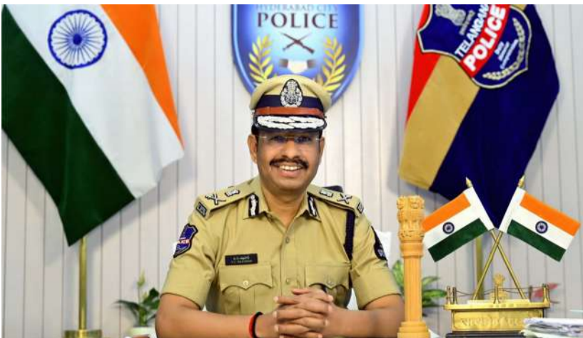
హైదరాబాద్ వెలుతురు మే 23: