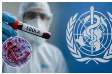
ఆరోగ్య శాఖ మంత్రి సూచన ఆంధ్రప్రదేశ్ వెలుతురు మే 24:

ఎబోలా వైరస్ వ్యాప్తి నేపథ్యంలో ఆంధ్రప్రదేశ్ ప్రభుత్వం అప్రమత్తమైంది. ముఖ్యంగా కాంగో, ఉగాండా, దక్షిణ సూడాన్ వంటి ఆఫ్రికా దేశాల నుంచి వచ్చే ప్రయాణికులపై ప్రత్యేక నిఘా ఏర్పాటు చేసినట్లు అధికారులు తెలిపారు. వైరస్ వ్యాప్తిని అరికట్టేందుకు అన్ని స్థాయిల్లో ముందస్తు చర్యలు చేపట్టినట్లు వెల్లడించారు. విశాఖపట్నం, తిరుపతి, విజయవాడ అంతర్జాతీయ విమానాశ్రయాల్లో ప్రత్యేక వైద్య పరీక్షలు నిర్వహిస్తున్నారు. ప్రయాణికుల ట్రావెల్ హిస్టరీ ఆధారంగా స్క్రీనింగ్ చేసి, అనుమానాస్పద లక్షణాలు ఉన్నవారిని వెంటనే క్వారంటైన్ కు తరలించేందుకు ఏర్పాటు చేశారు. విశాఖ పోర్టులో కూడా ప్రత్యేక పర్యవేక్షణ కొనసాగుతోంది. రోడ్డు మార్గాల ద్వారా రాష్ట్రంలోకి వచ్చే ప్రయాణికులపై నిఘా పెంచినట్లు సమాచారం. ఎబోలా నియంత్రణకు ప్రత్యేక యాక్ష్న్ ప్లాన్