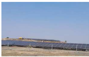
మహిళా వారోత్సవాల్లో భాగంగా ప్రారంభం కానున్న ఖమ్మం జిల్లాలోని మహిళా సోలార్ విద్యుత్ ఫ్యాంటు

ముఖ్యమంత్రి రేవంత్ రెడ్డి నాయకత్వంలో, పంచాయతీ గ్రామీణాభివృద్ధి, మహిళా శిశు సంక్షేమ శాఖ మంత్రి డా. దనసరి అనసూయ సీతక్క మార్గదర్శకత్వంలో మహిళా సంఘాలను అభివృద్ధి కేంద్రాలుగా మార్చే దిశగా ప్రభుత్వం కీలక నిర్ణయాలు తీసుకుంటోంది. మహిళా సంఘాలకు ఈ ఐడీకేలో బ్యాంక్ లింకేజీ ద్వారా లక్ష కోట్ల రూపాయల రుణ సదుపాయం కల్పించాలని ప్రభుత్వం లక్ష్యంగా పెట్టుకుంది. ఈ నేపథ్యంలో ప్రజా ప్రభుత్వం అధికారంలోకి వచ్చిన తర్వాత ఇప్పటి వరకు మహిళా సంఘాలకు రూ.60,487 కోట్ల రుణాలు అందించారు. వీటి ద్వారా వేల లక్షల మహిళా వారోత్సవాల సొంతంగా వ్యాపారాలు చేసుకుంటున్నారు.