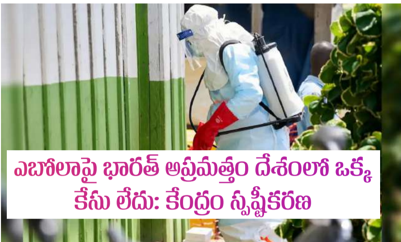
ఎబోలాపై భారత్ అప్రమత్తం దేశంలో ఒక్క కేసు లేదు: కేంద్రం స్పష్టికరణ

వేగంగా వ్యాప్తి చెందుతున్న నేపథ్యంలో భారత్ అప్రమత్తమైంది. ప్రపంచ ఆరోగ్య సంస్థ (డబ్ల్యూ. హెచ్.ఎస్) ఎబోలాను అంతర్జాతీయ స్థాయిలో అందోళనకరమైన ప్రజారోగ్య అత్యవసర పరిస్థితిగా ప్రకటించడంతో కేంద్ర ప్రభుత్వం అప్రమత్త చర్యలు ప్రారంభించింది. దేశంలో ఇప్పటి వరకు ఒక్క ఎబోలా కేసు కూడా నమోదు కాలేదని కేంద్ర ఆరోగ్యశాఖ స్పష్టం చేసింది. అయినప్పటికీ ముందస్తు జాగ్రత్త చర్యల్లో భాగంగా దేశవ్యాప్తంగా నిఘా పెంచినట్లు వెల్లడించింది. ఈ నేపథ్యంలో కేంద్ర వైద్యారోగ్య శాఖ మంత్రి Jagat Prakash Nadda సోమవారం ఉన్నతస్థాయి సమీక్ష సమావేశం నిర్వహించారు. దేశంలో ఎబోలా వైరస్ వ్యాప్తి చెందకుండా తీసుకోవాల్సిన చర్యలపై సీనియర్ అధికారులతో సమగ్రంగా చర్చించారు. ముఖ్యంగా విదేశాల నుంచి వచ్చే ప్రయాణికుల ద్వారా వైరస్ వ్యాప్తి చెందే అవకాశాలపై అప్రమత్తంగా ఉండాలని అధికారులకు సూచించారు. దేశంలోని అన్ని అంతర్జాతీయ ఎయిర్పోర్టులు, సముద్ర తీర ప్రాంత పోర్టులు, భూ సరిహద్దు చెక్ పోస్టుల్లో ప్రత్యేక స్క్రీనింగ్ వ్యవస్థలు ఏర్పాటు చేయాలని కేంద్ర మంత్రి ఆదేశించారు. విదేశాల