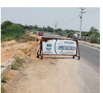
వర్షాకాలం రాకముందే చెరువు కట్ట రోడ్డును మరమ్మత్తు చేసారని ఆశాభావం వ్యక్తం చేస్తున్నారు.

పోసిన మట్టి నిలవకుండా రోడ్డు మరమ్మత్తుకు వీలు పడలేదు. చెరువులో నీరు అధికంగా ఉన్నప్పుడు రోడ్డును బాగు చేయలేమని నీరు తగ్గాక ఎండాకాలం అయితే సరైన సమయం అని బారెట్లు, లైట్ లు పెట్టి వాయిదా వేశారు. అయితే ప్రస్తుతం కొన్ని రోజుల నుండి చెరువులో నీరు చాలా పరకు తగ్గి పోయింది. ఎండాకాలం కూడా కొన్ని రోజులలో గడిచిపోయింది. వర్షాకాలం జూన్ నెలలో రానున్న సేపట్లో ఇప్పుడు ఉన్న రోడ్డు కూడా వర్షాలకు కుంగిపోతే కొందగడప, కాశవారి గూడెం, దాబంగ్లా ప్రజలు రాకపోకలకు తీవ్ర ఇబ్బందులు ఎదురౌతుంటారు. కావున అధికారులు