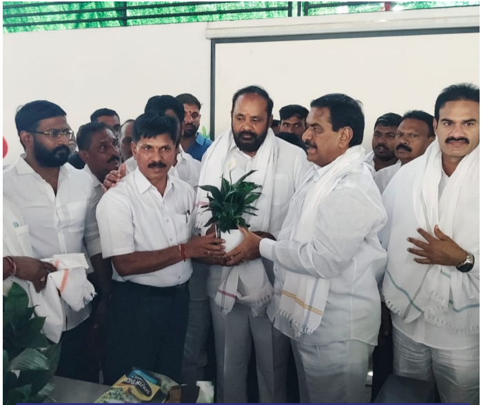
ఆరుట్ల తెలంగాణ పబ్లిక్ పాఠశాలలో ప్రసంగిస్తున్న ఇబ్రహీంపట్నం ఎమ్మెల్యే మల్ రెడ్డి రంగారెడ్డి