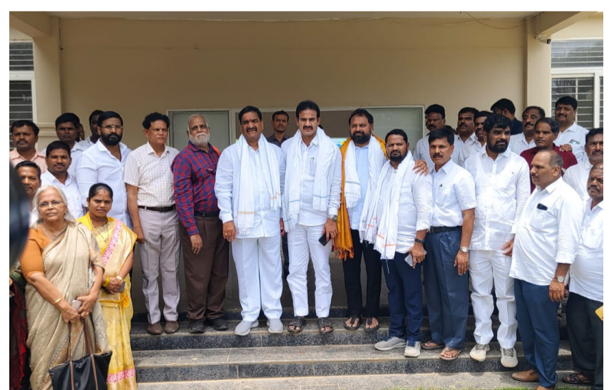
ఆరుట్ల తెలంగాణ పబ్లిక్ పాఠశాల ను పరిశీలిస్తున్న ఇబ్రహీంపట్నం ఎమ్మెల్యే మల్ రెడ్డి రంగారెడ్డి ఎమ్మెల్యేల బృందం