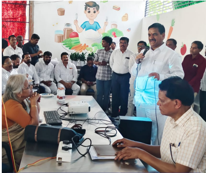
ఆరుట్ల తెలంగాణ పబ్లిక్ పాఠశాలలో ప్రసంగిస్తున్న ఇబ్రహీంపట్నం ఎమ్మెల్యే మల్ రెడ్డి రంగారెడ్డి