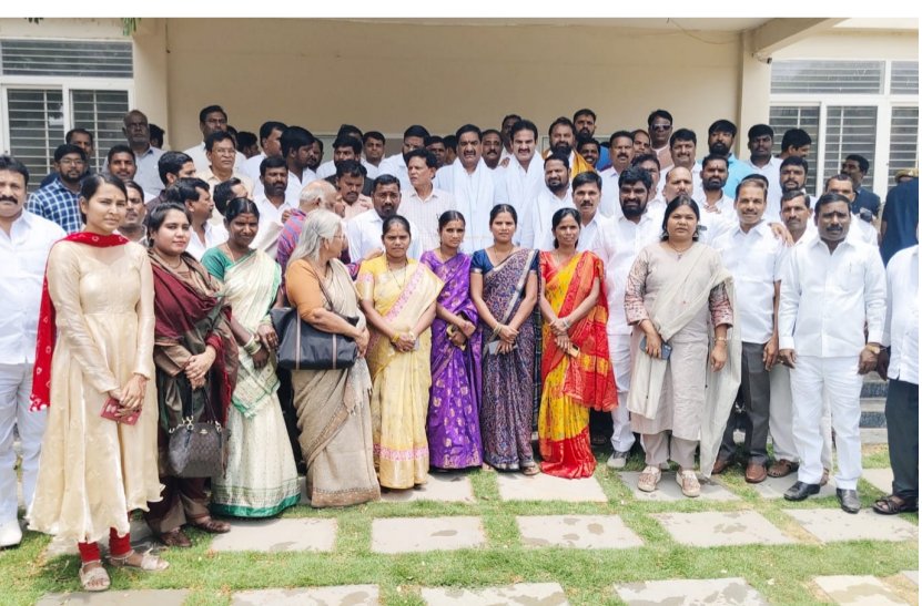
ఆరుట్ల గ్రామంలో తెలంగాణ పబ్లిక్ పాఠశాల ను సందర్శించిన ఇబ్రహీంపట్నం ఎమ్మెల్యే మల్ రెడ్డి రంగారెడ్డితో కలిసి సందర్శించిన ఎమ్మెల్యేల బృందం