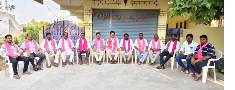
హోదాలో ఉండి చిల్లరమాటలు మాట్లాడటం మానుకోవాలన్నారు. మీరే తప్ప మాట్లాడి దాన్ని ఖండించిన దానికి మా పై దాడులచేస్తామంటే ఊరుకోమని దానికి ప్రతి దాడులు చేస్తే పరిణా