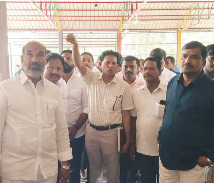
ఆరుట్ల తెలంగాణ పబ్లిక్ పాఠశాలలో ప్రసంగిస్తున్న ఇబ్రహీంపట్నం ఎమ్మెల్యే మల్ రెడ్డి రంగారెడ్డి