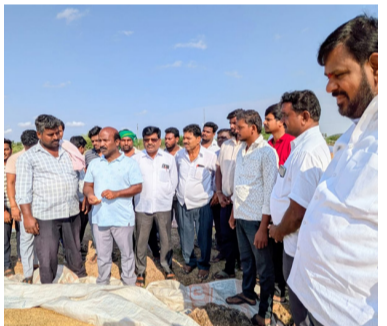
దయనీయంగా మారినది ఆయన విమర్శించారు. ప్రభుత్వం వద్ద కొనుగోళ్లు సక్రమంగా నిర్వహించకపోవడంతో రైతులు తీవ్ర ఇబ్బందులు ఎదుర్కొంటున్నారని అన్నారు. సరిపడా లారీలు లేక రైతులు ధాన్యాన్ని తరలించేందుకు