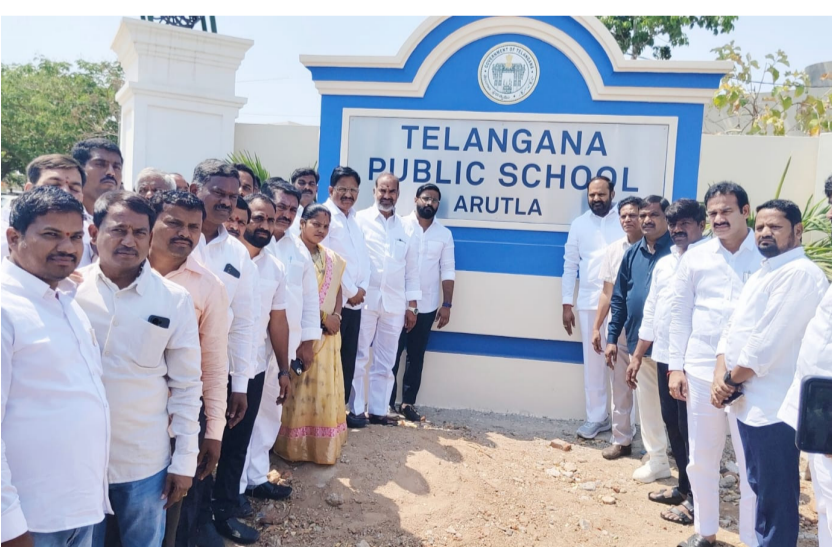
ఆరుట్ల తెలంగాణ పబ్లిక్ పాఠశాల ముఖద్వారం దగ్గర తెలంగాణ రాష్ట్ర ఎమ్మెల్యేల బృందం విద్యా కమిషన్ చైర్మన్ ఆకునూరి మురళి ఆరుట్ల గ్రామ సర్పంచ్ మానిపాటి శోభా కుమార్

• ఆరుట్ల తెలంగాణ పాఠశాల ప్రవేట్ పాఠశాలలకు దీటుగా అన్ని రకాల వసతులతో అన్ని అంగులతో నిర్మాణాలు అద్భుతంగా ఉన్నాయి • ఎమ్మెల్యేల బృందం మంచాల వెలుతురు మే 08: మంచాల మండలం ఆరుట్ల గ్రామంలో తెలంగాణ