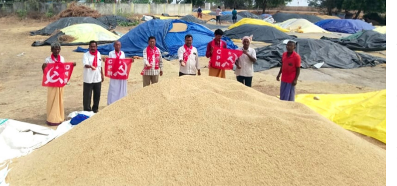
టిమట్ల గ్రామంలో పార్టీ నాయకులతో కలిసి ధాన్యం కొనుగోలు కేంద్రాన్ని పరిశీలించారు. అనంతరం ఆయన మాట్లాడుతూ..... ఒకవైపు రైతులు కోతలు పూర్తిచేసి దాన్యాన్ని కళ్ళాల్లో కుప్పలుగా నిల్వచేసి కొనుగోలు కోసం రైతులు

ధాన్యం కొనుగోళ్లు వేగవంతం చేసి, రైతుల సమస్యలు పరిష్కరించాలి సిపిఎం మోతూర్ వెలుతురు న్యూస్ మే 08: