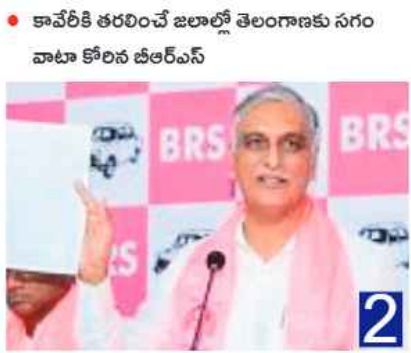
కావేరికి తరలించే జలాల్లో తెలంగాణకు సగం వాటా కోరిన బీఆర్ఎస్