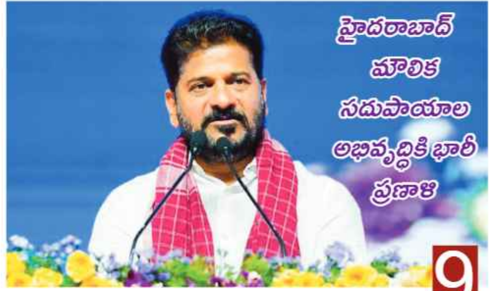
హైదరాబాద్ మౌలిక సదుపాయాల అభివృద్ధికి భారీ ప్రణాళి