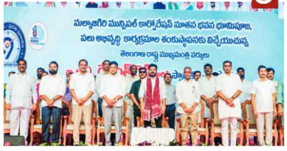
మల్కాజ్ గిరి మున్సిపల్ కార్పొరేషన్ సూతన భవన భూమిపూజ, పలు అభివృద్ధి కార్యక్రమాల శంకుస్థాపనకు విచ్చేయుచున్న తెలంగాణ రాష్ట్ర ముఖ్యమంత్రి వర్రులు