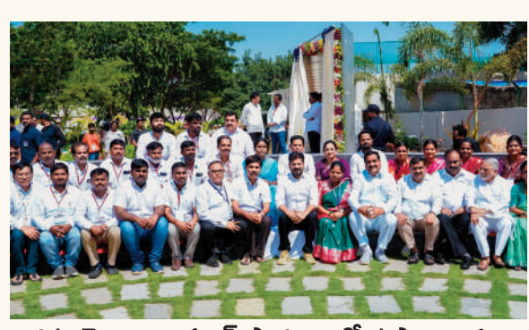
ఆరుట్ల తెలంగాణ పబ్లిక్ పాఠశాలలో ఉపాధ్యాయులు విద్యార్థులు కమిటీ సభ్యులతో కలిసి ముఖ్యమంత్రి రేవంత్ రెడ్డి గారు