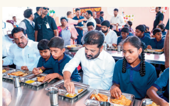
విద్యార్థులతో అల్పాహారం చేస్తున్న ముఖ్యమంత్రి రేవంత్ రెడ్డి గారు