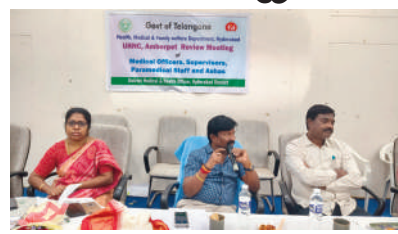
UPHC, ముషీరాబాద్ UPHC, బోల్కపూర్ UPHC, AMS UPHC, హరాజ్ పెంట UPHC మరియు తిలక్ నగర్ UPHCలకు చెందిన వైద్యాధికారులు, సూపర్వైజర్లు, హెల్త్ అనిస్టెంట్లు, ANMలు మరియు ఆశా కార్యకర్తలతో సమీక్ష సమావేశం నిర్వహించబడింది. ఈ సందర్భంగా DM&HO గారు మాట్లాడుతూ, ప్రజలకు నాణ్యమైన, అందుబాటులో ఉండే ఆరోగ్య సేవలను సమర్థవంతంగా అందించడం ప్రతి ఆరోగ్య సిబ్బంది బాధ్యత అని పేర్కొన్నారు.