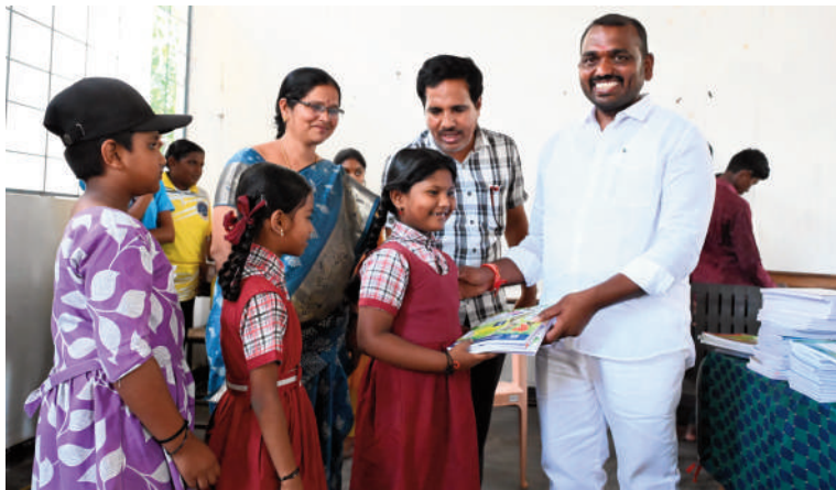
ముందంజలో నిలవడం ఆనందదాయకమని మాదిరిగానే ఈ విదాది కూడా కేంద్ర మేయర్ పేర్కొన్నారు. అలాగే గత సంవత్సరం హోంశాఖ సహాయ మంత్రి శ్రీ బండి