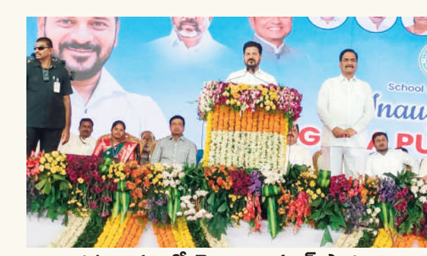
ఆరుట్ల గ్రామంలో తెలంగాణ పబ్లిక్ పాఠశాల ప్రారంభోత్సవ సభలో ప్రసంగిస్తున్న ముఖ్యమంత్రి రేవంత్ రెడ్డి గారు