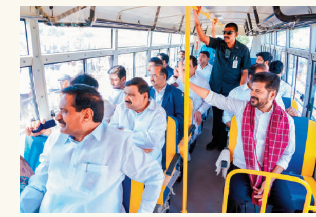
తెలంగాణ పబ్లిక్ పాఠశాల స్కూల్ బస్సులో ప్రయాణిస్తున్న ముఖ్యమంత్రి రేవంత్ రెడ్డి గారు