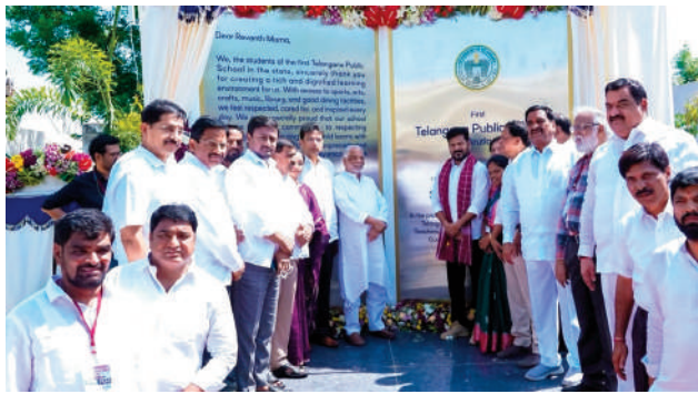
రంగారెడ్డి జిల్లా వెలుతురు జూన్ 17:

రాష్ట్రంలోని 27 లక్షల మంది విద్యార్థులకు తెలంగాణ పబ్లిక్ స్కూల్ (టీపీఎస్) స్ఫూర్తిదాయకంగా నిలుస్తుందని ముఖ్యమంత్రి రేవంత్ రెడ్డి పేర్కొన్నారు. రంగారెడ్డి జిల్లా ఆరుట్లలో రూ.15 కోట్ల వ్యయంతో అంతర్జాతీయ ప్రమాణాలకు అనుగుణంగా నిర్మించిన తెలంగాణ పబ్లిక్ స్కూల్ను ఆయన మంగళవారం ప్రారంభించారు. ఈ సందర్భంగా పాఠశాలలో ఏర్పాటు చేసిన డిజిటల్ క్లాస్ రూమ్స్, ఆధునిక లైబ్రరీ, సైన్స్ ల్యాబ్స్, అత్యాధునిక కిచెన్, డైనింగ్ హాల్ తదితర సదుపాయాలను పరిశీలించారు. అనంతరం విద్యార్థులతో కలిసి అన్నాహారం చేసి, పాఠశాల ఆవరణలోని క్రీడా మైదానంలో విద్యార్థులతో సరదాగా ఫుట్ బాల్ ఆడారు. ఈ సందర్భంగా నిర్వహించిన సభలో సీఎం మాట్లాడుతూ రాష్ట్ర ప్రభుత్వం విద్యారంగానికి అత్యంత ప్రాధాన్యం ఇస్తోందని చెప్పారు. రాష్ట్ర బడ్జెట్ లో దాదాపు రూ.27 వేల కోట్లు విద్యాశాఖపైనే ఖర్చు చేస్తున్నామని తెలిపారు.