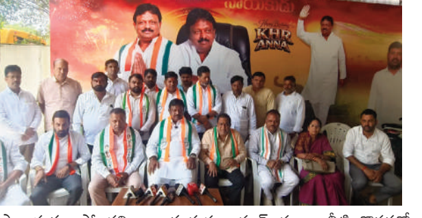
ప్రాధాన్యత ఇస్తోందని అన్నారు. కుత్బుల్లాపూర్ ప్రజలు నీటి కొరతతో ఇబ్బందులు పడకుండా చూడటం తమ బాధ్యత అని పేర్కొన్న హన్మంత్ రెడ్డి, రాబోయే ఏడాది కాలంలో నియోజకవర్గంలో ఎలాంటి మంచినీటి సమస్య లేకుండా చేయడానికి కృషి చేస్తామని హామీ ఇచ్చారు. ప్రజల సమస్యల పరిష్కారమే కాంగ్రెస్ ప్రభుత్వ ప్రధాన లక్ష్యమని, ప్రతి కాలానికి తగినంత తాగునీటి సరఫరా అందేలా ప్రత్యేక కార్యాచరణ ప్రణాళికతో ముందుకు వెళ్తున్నామని వెల్లడించారు.

కుత్బుల్లాపూర్ నియోజకవర్గంలో వెలకొన్న మంచినీటి సమస్యల పరిష్కారం కోసం కాంగ్రెస్ పార్టీ నియోజకవర్గ ఇంచార్జ్ కొలన్ హన్మంత్ రెడ్డి స్థానిక నాయకులతో కలిసి వాటర్ల వర్క్స్ ఎంపీ అశోక్ రెడ్డి ని కలిసి వినతిపత్రం అందజేశారు. ఈ సందర్భంగా నిజాంపేట్ మున్సిపల్ కార్పొరేషన్తో పాటు కుత్బుల్లాపూర్ నియోజకవర్గంలోని పలు ప్రాంతాల్లో ప్రజలు ఎదుర్కొంటున్న తాగునీటి సమస్యలను ఎంపీ దృష్టికి తీసుకెళ్లి, వాటి పరిష్కారానికి తక్షణ చర్యలు చేపట్టాలని కోరారు. సమస్యలను త్వర తగతిన పరిష్కరించేందుకు అధికారులు సానుకూలంగా స్పందించినట్లు హన్మంత్ రెడ్డి తెలిపారు. అనంతరం బాచుపల్లిలోని కాంగ్రెస్ పార్టీ కార్యాలయంలో మీడియాతో మాట్లాడిన ఆయన, గత 15 సంవత్సరాలలో జరగని అభివృద్ధి ప్రభుత్వ హయాంలో జరుగుతోందని పేర్కొన్నారు. ముఖ్యమంత్రి ఎ. రేవంత్ రెడ్డి నాయకత్వంలో రాష్ట్రవ్యాప్తంగా మౌలిక సదుపాయాల అభివృద్ధికి ప్రభుత్వం అత్యంత